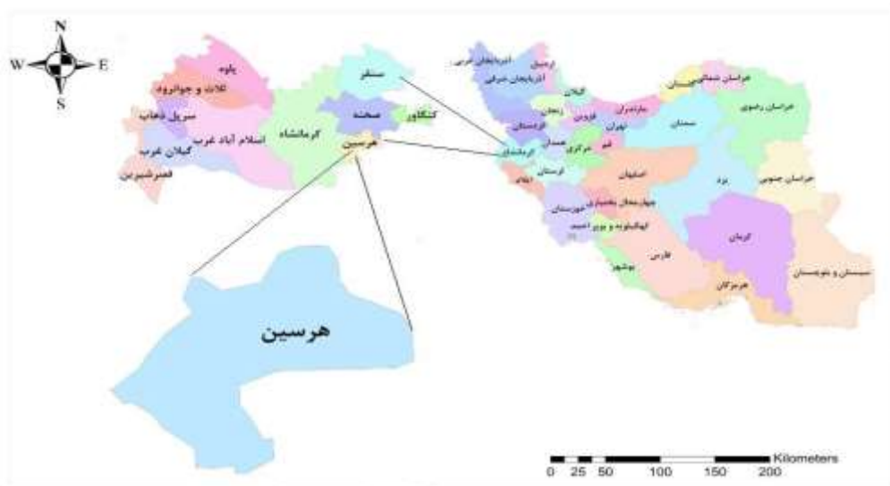
شکل (۱): نقشه منطقه مطالعاتی (شهرستان هرسین)

۴۴ متر، طول تاج سد ۳۴۵ متر، تراز تاج سد ۱۴۹۷ متر و تراز نرمال ۱۴۹۱ متر می‌باشد. این سد بر روی رودخانه کمیش از سر شاخه‌ی رودخانه گاماسیاب و در حوضه آبریز رودخانه‌ی سیمره واقع شده است (شکل ۱). رودخانه گاماسیاب پس از تلاقی با رودخانه قره سو، رودخانه سیمره را تشکیل داده و با بهم پیوستن رودخانه‌ی چرداول و کشکان به رودخانه کرخه منتهی می‌شود. بخش عمده آبدهی رودخانه کمیش از چشمه سر آب هرسین که دارای منشا کارستی است تامین می‌شود. متوسط آبدهی دراز مدت سالانه چشمه سر آب هرسین ۳۶/۳ میلیون متر مکعب می‌باشد. در بالادست سد نیازهای کشاورزی و شهری وجود دارند که قسمتی از نیازهایشان را از چشمه‌ی هرسین تامین می‌کنند و همچنین از آب زیر زمینی بالا دست سد برای کشاورزی و از تصفیه خانه در حال ساخت هرسین برای نیاز شهری آب رهاسازی می‌شود.