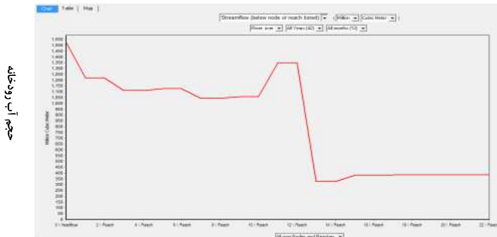
رودخانه کمیش در مسیر پروژه شکل (۴): نمودار رودخانه کمیش

مقدار نیاز زیست‌محیطی رودخانه به روش تنانت محاسبه و در ویپ شبیه‌سازی گردید. طبق این روش باید حداقل نیاز زیست‌محیطی تامین گردد وضعیت رودخانه کمیش، در نمودار نشان می‌دهد که در طول دوره شبیه‌سازی با توجه به اینکه در پایین دست نیاز زیست محیطی تعریف شده رودخانه خشک نشده است. به دلیل به هنگام بودن جریان آب در روخانه بعد از برداشت آب برای هر نیاز آب باقی مانده در رودخانه جریان می‌یابد و در مسیر خود با اضافه شدن پساب کشاورزی به تامین سایر نیازها کمک می‌کند. آب جریان یافته در قسمت‌های مختلف روخانه را نشان می‌دهد و کاملاً روشن است که جریان آب در رودخانه بعد از تامین نیازها کاهش یافته و با اضافه شدن آب برگشتی از کشاورزی افزایش می‌یابد (شکل ۴).