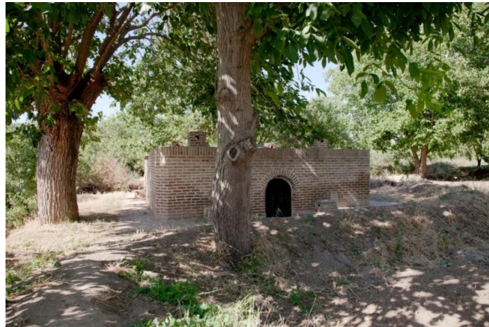
شکل (۷): نمونه‌ای از چاه خانه‌های مرمت شده در باغستان سنتی قزوین

با توجه به نحوه مدیریت منابع آبهای سطحی در باغستان سنتی، سیلاب فصلی مواد مغذی مناسبی را همراه رسوب به باغستان منتقل نموده و خاک باغستان دائماً بازسازی می‌گردد. از این‌رو کیفیت مطلوب خاک، عدم محدودیت در عمق خاک زراعی و عمیق بودن محدوده توسعه ریشه‌ها، آب مورد نیاز گیاه را تأمین نموده و محصول خوبی را عاید باغبانان و باغداران می‌کند. بر این اساس حلقه باغستان سنتی پیرامون شهر قزوین در طی قرن‌های مختلف رسوبات ناشی از بارندگی سالیانه را در خود نگه داشته و خاک حاصلخیز حاوی مواد آلی و معدنی با عمق متوسط حدود ۲۰ متر را ایجاد کرده است (اخوی‌زادگان، ۱۳۸۱).