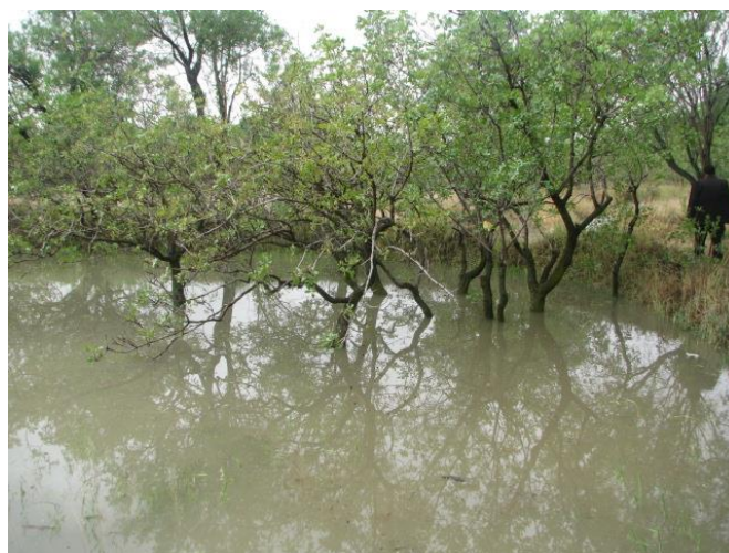
شکل (۴): نمونه‌ای از روش آبیاری در باغستان سنتی شهر قزوین

با توجه به آنکه تأمین آب باغستان سنتی مبتنی بر استفاده از سیلاب زمستانه و بهاره بوده لذا روش‌های مهار سیلاب در محدوده باغستان سنتی نیز به‌عنوان یک عنصر هویت بخش قابل بررسی می‌باشد. آبیاری در باغستان‌های سنتی به سه شیوه بیل کش (هدایت بوته به بوته آب)، تخت (پوشش سطحی آب در تمام باغ) و لب به لب (آبیاری تا حد بالای مرز خاکی) انجام می‌گرفته که در این حالت، آب آبیاری طی مدت چندین شبانه روز به اعماق خاک نفوذ داشته است. (عرب‌خدری و همکاران، ۱۳۸۷). نکته حائز اهمیت آن است که در تمامی شیوه‌های آبیاری اشاره شده سازه کنترلی خاصی (همانند دریچه، روزنه و ...) جهت مدیریت آبیاری در سطح باغات وجود نداشته و فرآیند کنترل سیلاب توسط میراب‌ها در سطح باغات مدیریت می‌گردیده است. در شکل (۴) نمونه‌ای از روش آبیاری باغ‌های سنتی نشان داده شده است.