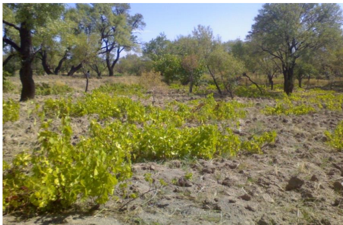
شکل (۵): نمونه‌ای از کشت ترکیبی انگور، بادام و زردآلو در باغستان سنتی شهر قزوین

یکی دیگر از مشخصه‌های فیزیکی باغستان سنتی، بناهایی با عنوان چاه خانه با شاخص‌های ویژه به لحاظ کاربری و تأمین نیازهای باغدار، باغستان و سازگار با اقلیم طبیعی منطقه است. چاه خانه‌ها در طول سده‌ها پناهگاه باغداران بوده و نمایانگر الگوی اصیلی از ارتباط بین انسان، طبیعت و معماری می‌باشند و هر چاه خانه به نام همان محل یا نام سازنده آن شناخته می‌شود. بنای چاه خانه‌ها معمولاً از آجر و ملات خشت و گل ساخته شده‌اند. این بناها اطاقی به ابعاد ۴×۴ و ارتفاع حدود ۳ متر دارند که دارای دیوارهای پهن و طاق ضربی هستند که عمدتاً سطح کف آن از سطح زمین، پائین‌تر می‌باشد. چاه خانه‌ها دارای هواکش و راه پله بوده و فضای چاه خانه به‌عنوان استراحتگاه مشترک باغبانان و محل انبار وسایل آنان بوده و در زمان آبیاری و به‌خصوص در فصل محصول برای حفاظت از محصولات باغی استفاده می‌شده است. شکل‌های (۶) و (۷) نمونه‌هایی چاه خانه‌های احداث شده در باغستان سنتی را نشان داده است. نکته حائز اهمیت آن است که تأمین آبشخور حیوانات اهلی نیز در محدوده باغستان سنتی مورد توجه باغداران بوده و به این امر نیز اهتمام داشته‌اند به نحوی که حتی در دوره‌های خشک سال نیز آب مورد نیاز احشام از چاه‌های موجود در سطح باغستان تأمین می‌گردیده است.