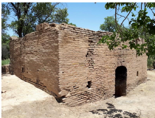
شکل (۶): نمونه‌ای از چاه خانه‌های احداث شده در باغستان سنتی قزوین

یکی دیگر از مشخصه‌های فیزیکی باغستان سنتی، بناهایی با عنوان چاه خانه با شاخص‌های ویژه به لحاظ کاربری و تأمین نیازهای باغدار، باغستان و سازگار با اقلیم طبیعی منطقه است. چاه خانه‌ها در طول سده‌ها پناهگاه باغداران بوده و نمایانگر الگوی اصیلی از ارتباط بین انسان، طبیعت و معماری می‌باشند و هر چاه خانه به نام همان محل یا نام سازنده آن شناخته می‌شود. بنای چاه خانه‌ها معمولاً از آجر و ملات خشت و گل ساخته شده‌اند. این بناها اطاقی به ابعاد ۴×۴ و ارتفاع حدود ۳ متر دارند که دارای دیوارهای پهن و طاق ضربی هستند که عمدتاً سطح کف آن از سطح زمین، پائین‌تر می‌باشد. چاه خانه‌ها دارای هواکش و راه پله بوده و فضای چاه خانه به‌عنوان استراحتگاه مشترک باغبانان و محل انبار وسایل آنان بوده و در زمان آبیاری و به‌خصوص در فصل محصول برای حفاظت از محصولات باغی استفاده می‌شده است. شکل‌های (۶) و (۷) نمونه‌هایی چاه خانه‌های احداث شده در باغستان سنتی را نشان داده است. نکته حائز اهمیت آن است که تأمین آبشخور حیوانات اهلی نیز در محدوده باغستان سنتی مورد توجه باغداران بوده و به این امر نیز اهتمام داشته‌اند به نحوی که حتی در دوره‌های خشک سال نیز آب مورد نیاز احشام از چاه‌های موجود در سطح باغستان تأمین می‌گردیده است.