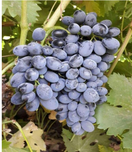
شکل (۸): نمونه‌ای از محصول انگور شاهانی در باغستان سنتی قزوین

یکی از مهمترین ویژگی‌های درختان مثمر باغستان آن است که با یک بار آبیاری غرقابی در سال، محصول اقتصادی دارند. از سوی دیگر الگوی کشت در باغستان سنتی به صورت مختلط و نامنظم بوده و عمدتاً در یک باغ درختان متنوعی بدون نظم خاصی قرار گرفته‌اند. بنابراین درختان میوه موجود در باغستان سنتی متفاوت از یکدیگر هستند و تنوع زیادی از نظر میزان محصول، کیفیت میوه‌ها، اندازه درخت، مقاومت به سرمای بهاره و حساسیت و مقاومت به آفات و بیماری‌ها در بین آنها وجود داشته است. تنوع ارقام گیاهی موجود از نظر اکولوژیکی و امکان گزینش ارقام برتر در اصلاح درختان میوه، مزیت بزرگی در باغستان‌ها به شمار می‌آید (اخوی‌زادگان، ۱۳۸۱).