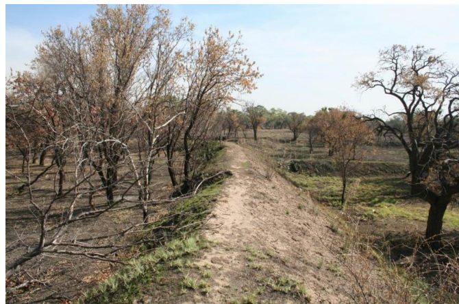
شکل (۲): نمونه‌ای از مرزبندی باغستان سنتی به منظور مهار سیلاب‌های فصلی در شهر قزوین

آبیاری باغ‌های سنتی عمدتاً در دو نوبت یا سه نوبت (در دوره‌های پرآبی) در سال، یکی در زمستان و دیگری در بهار صورت می‌گرفته و در هر نوبت آبیاری حدود ۴۰۰۰ تا ۵۰۰۰ مترمکعب در هکتار آب به باغ‌های داده می‌شد (یوسف گمرکچی، ۱۳۹۶). بر این اساس بسته به بافت خاک و نوع کشت و کار، بخش عمده‌ای از آب آبیاری نفوذ یافته و باعث تغذیه سفره آب زیرزمینی می‌گردیده است. ضمن اینکه سامانه ایجاد شده در فصل غیر زراعی، باعث نفوذ بیشتر جریان سطحی رودخانه‌ها می‌شد. این در حالی است که هزینه‌های ایجاد این روش پخش سیلاب ناچیز بوده است. در شکل (۲) نمونه‌ای از مرزبندی باغستان سنتی به منظور مهار سیلاب فصلی نشان داده شده است.