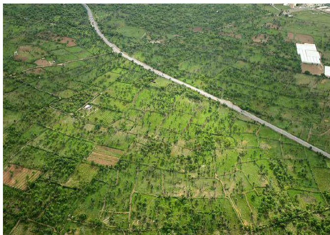
شکل (۳): نمونه‌ای از الگوی تقسیم‌بندی و سیمای زمین در عرصه باغستان سنتی شهر قزوین

با توجه به آنکه تأمین آب باغستان سنتی مبتنی بر استفاده از سیلاب زمستانه و بهاره بوده لذا روش‌های مهار سیلاب در محدوده باغستان سنتی نیز به‌عنوان یک عنصر هویت بخش قابل بررسی می‌باشد. آبیاری در باغستان‌های سنتی به سه شیوه بیل کش (هدایت بوته به بوته آب)، تخت (پوشش سطحی آب در تمام باغ) و لب به لب (آبیاری تا حد بالای مرز خاکی) انجام می‌گرفته که در این حالت، آب آبیاری طی مدت چندین شبانه روز به اعماق خاک نفوذ داشته است. (عرب‌خدری و همکاران، ۱۳۸۷). نکته حائز اهمیت آن است که در تمامی شیوه‌های آبیاری اشاره شده سازه کنترلی خاصی (همانند دریچه، روزنه و ...) جهت مدیریت آبیاری در سطح باغات وجود نداشته و فرآیند کنترل سیلاب توسط میراب‌ها در سطح باغات مدیریت می‌گردیده است. در شکل (۴) نمونه‌ای از روش آبیاری باغ‌های سنتی نشان داده شده است.