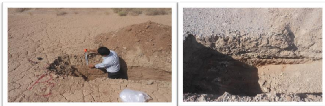
شکل (۵): مقایسه ظاهری پروفیل خاک در منطقه شاهد (تصویر سمت راست) و پخش سیلاب (تصویر سمت چپ)