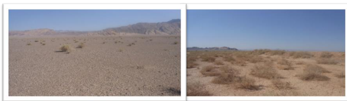
شکل (۴): مقایسه ظاهری عرصه قبل (تصویر سمت چپ) و بعد (تصویر سمت راست) از گسترش سیلاب

پس از آمار برداری از عرصه‌های سیل‌گیری شده مراتع بیابانی حاشیه خشک رود شور سیریز و مناطق بدون سیل گیری (شاهد) نشان داد که طی ۱۰ سال گذشته گیاهان چند ساله از جمله گونه‌های Artemisia sieberi ، Salsola ، Yazdiana و Zygophyllum eurypterum که از گونه‌های خوشخوراک مناطق خشک می‌باشند بذر آنها از طریق سیلاب به این مرتع بیابانی وارد و با تغییر شرایط خاک و رطوبت امکان استقرار یافته اند (جدول ۱). همچنین زاد آوری، تراکم و تولید علوفه گونه های مرتعی Hammada salicornicum و Sedlitzia rosmarinus نیز بطور چشمگیری افزایش یافته است. در مجموع درصد تاج پوشش عرصه پخش ۶/۴ درصد بیشتر از شاهد است. روند تغییرات تاج پوشش در عرصه پخش سیلاب نیز در سطح احتمال ۱ درصد معنی‌دار شده که نقش گونه‌های یکساله نیز شاخص بوده است. این نتایج با تحقیقات انجام شده توسط Barkhordari و همکاران (۲۰۱۴) در منطقه سرچاهان، Dahmardeh و همکاران (۲۰۱۹) در منطقه سیستان و میرجلیلی و رهبر (۱۳۸۶) در هرات با شرایط اقلیمی مشابه تطابق دارد. شکل (۴) مقایسه دو عرصه را قبل و بعد از گسترش سیلاب به وضوح نشان می‌دهد.