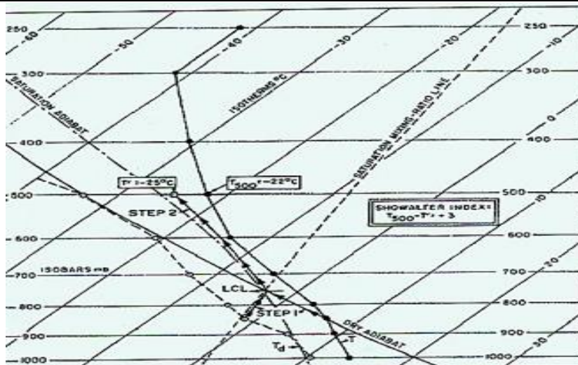
شکل(۱): تعیین مرحله به مرحله شاخص شولتر بر نمودار اسکویوتی