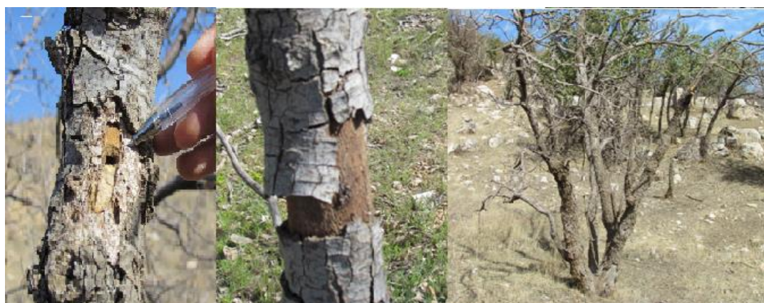
شکل (۳): درختان بلوط دچار خشکیدگی مورد هجوم آفات و بیماری قرار می‌گیرند