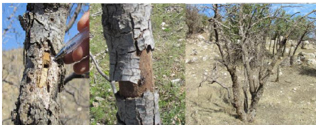
شکل (۳): درختان بلوط دچار خشکیدگی مورد هجوم آفات و بیماری قرار می‌گیرند