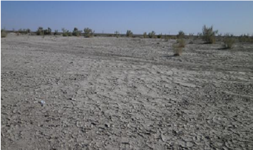
شکل (۴): نمایی از رسوبگیری تورکینست در سال ۱۳۹۵

بررسی روند رسوبگیری تورکینست‌ها نشان می‌دهد که میزان رسوب ورودی به مخازن این سازه‌ها بستگی به شدت بارندگی داشته است. به طوری که معمولا باران‌های با شدت بارندگی ده میلی‌متر متوالی در بالا دست تورکینست‌ها، سبب ایجاد سیلاب و ورود آن به داخل این سازه‌ها می‌گردد. عمق رسوب در این سازه‌ها در برخی از نقاط ۷۰ سانتی‌متر و ضخامت متوسط رسوب ۵۰ سانتی‌متر می‌باشد. اندازه ضخامت لایه‌های رسوب ورودی به این تاسیسات در هر سیلاب به طور متوسط حدود ده میلی‌متر برآورد شده است (شکل ۴).