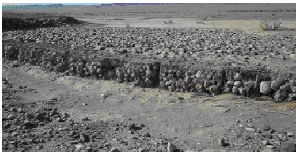
شکل (۲): نمایی از سرریز تورکینست در منطقه مورد بررسی

بوده است. خاک حوضه به خصوص در بالا دست به دلیل فرسایش از بین رفته و سطح زمین را سنگریزه پوشانده است. بنابراین با اجرای این سازه‌ها وضعیت خاک در محل اجرای طرح تغییر نموده، در صورتی که در منطقه شاهد روند فرسایش ادامه دارد. بدین منظور سه تورکینست هر یک به وسعت حدود سه هکتار و با گنجایش حدود ۱۰۰۰۰ متر مکعب آب انتخاب گردید. طول خاکریز هر یک از سازه‌ها به طور متوسط حدود ۲۵۰-۲۰۰ متر و ارتفاع آن‌ها ۱/۷۵-۱/۵ متر بوده است. با هر سیلاب مقداری رسوب داخل آن‌ها ته نشین شد. با توجه به زیادی میزان رواناب رودخانه، به منظور جلوگیری از تخریب آن، متناسب با حجم رواناب بر اساس حداکثر دبی سیلاب در قسمت شمالی هر تورکینست سر ریز از نوع تور سنگی به ارتفاع یک متر (با احتساب پی) و طول حدود ۱۵ متر ایجاد گردید تا در مواقع سیلاب آب بدون تخریب از تورکینست به پایین دست جریان یابد. پایین دست و جلوی سر ریزها با عرض حدود شش متر و ارتفاع حدود ۰/۳ متر به وسیله سنگ‌هایی با متوسط ابعاد حدود 25 \times 20 سانتی‌متر تثبیت گردیده است (شکل ۲).