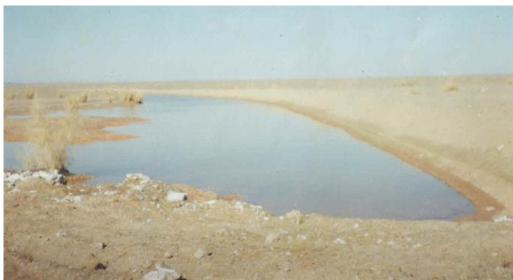
شکل (۳): نمایی از آبگیری تورکینست در سال ۱۳۷۶

وضعیت ورود سیلاب به گونه‌ای است که در هر سال به طور متوسط دو تا سه سیلاب وارد این سازه‌ها می‌گردد که اثرات مطلوبی در خصوص کنترل سیلاب و رسوب در پی داشته است (شکل ۳).