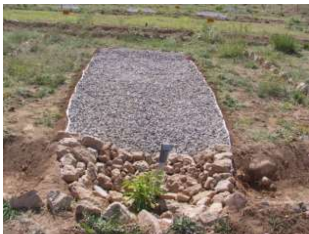
شکل (۴) نمایش از تیمار سامانه آبگیر عایق پس از احداث و کاشت نهال بادام

ج- تیمار جمع آوری پوشش گیاهی سطح سامانه (زمین تمیز شده) بدون به کارگیری فیلتر سنگریزه‌ای د- تیمار عایق نمودن سطح سامانه به همراه به کارگیری فیلتر سنگریزه‌ای. برای احداث این تیمار ابتدا پوشش گیاهی بخشی از سطح سامانه حذف شده و با استفاده از نایلون ضخیم و یک لایه سنگریزه بر روی آن، بستر سامانه عایق گردید. لایه سنگریزه به منظور محافظت پلاستیک در برابر نور خورشید به کار برده شد. در طراحی قسمت عایق در چاله نهال، سعی شد رواناب‌های استحصال شده مستقیماً به داخل فیلترها انتقال یابد. همچنین قسمت پایین دست سامانه در محل چاله نهال جهت کاهش تبخیر، با استفاده از قلوه سنگ‌های موجود در منطقه، سنگ فرش شد. در شکل‌های (۳) و (۴) مراحل احداث سطح عایق دیده می‌شود.