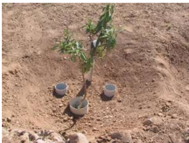
شکل (۲): جا نمایی فیلتر در چاله کشت نهال قبل از ریختن سنگریزه در آن

ج- تیمار جمع آوری پوشش گیاهی سطح سامانه (زمین تمیز شده) بدون به کارگیری فیلتر سنگریزه‌ای د- تیمار عایق نمودن سطح سامانه به همراه به کارگیری فیلتر سنگریزه‌ای. برای احداث این تیمار ابتدا پوشش گیاهی بخشی از سطح سامانه حذف شده و با استفاده از نایلون ضخیم و یک لایه سنگریزه بر روی آن، بستر سامانه عایق گردید. لایه سنگریزه به منظور محافظت پلاستیک در برابر نور خورشید به کار برده شد. در طراحی قسمت عایق در چاله نهال، سعی شد رواناب‌های استحصال شده مستقیماً به داخل فیلترها انتقال یابد. همچنین قسمت پایین دست سامانه در محل چاله نهال جهت کاهش تبخیر، با استفاده از قلوه سنگ‌های موجود در منطقه، سنگ فرش شد. در شکل‌های (۳) و (۴) مراحل احداث سطح عایق دیده می‌شود.