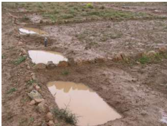
شکل (۵): وضعیت ذخیره رواناب در بانکت‌های احداث شده در دو طرف چاله نهال