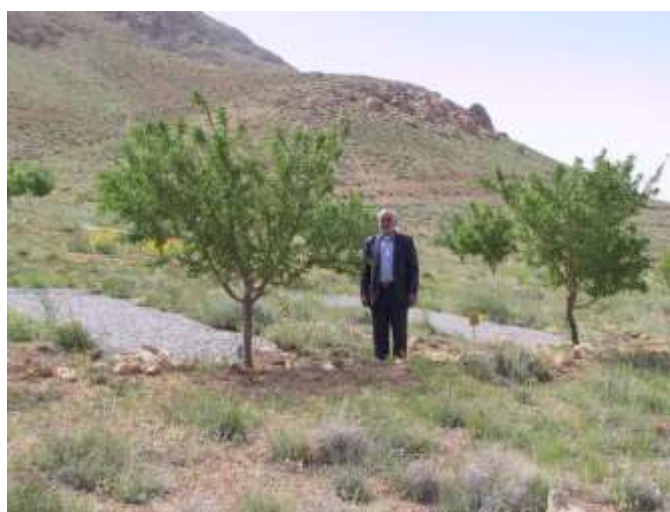
شکل (۶): رشد و نمو درخت بادام در تیمار عایق با فیلتر سنگریزه‌ای (سال پنجم اجرای پروژه)

*در هر ستون میانگین‌هایی که دارای حروف انگلیسی مشترک هستند در سطح ۵ درصد تفاوت معنی‌دار ندارند (a سطح بهینه و d کمترین میزان می‌باشد)