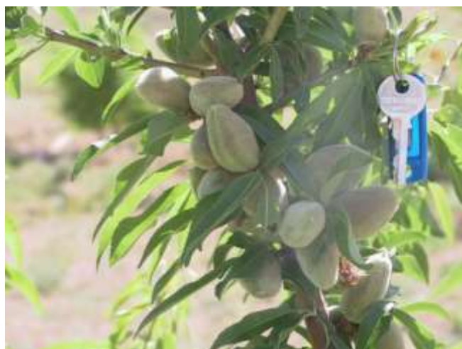
شکل (۷): میوه بادام در سامانه عایق با فیلتر سنگریزه‌ای