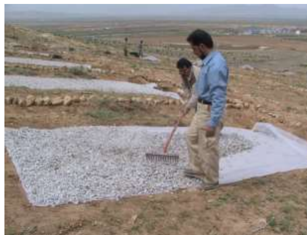
شکل (۳): عایق نمودن سطح سامانه آبگیر با استفاده از پلاستیک و سنگریزه

و- تیمار عایق نمودن سطح سامانه بدون به کارگیری فیلتر سنگریزه‌ای ۴- احداث دیوار عایق (تعبیه نایلون) در پایین دست چاله نهال با هدف کاهش سرعت جریان زیر سطحی به سمت پایین دامنه و افزایش طول جریان و همچنین افزایش وسعت پیاز رطوبتی پروفیل خاک ۵- احداث بانکت در دو طرف چاله نهال در پایین دست سامانه‌ها برای جمع آوری رواناب و افزایش رطوبت پروفیل خاک چاله نهال. در شکل (۵) وضعیت ذخیره رواناب در بانکت‌های احداث شده در دو طرف چاله نهال، پس از بارندگی در منطقه نشان داده شده است.