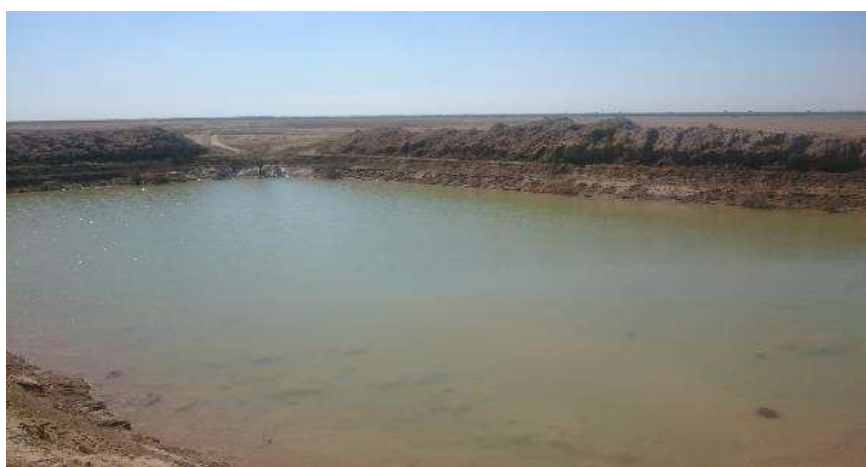
شکل (۹): گوراب مستطیل شکل - پایین دست روستای شریفیه

شکل (۸): نیاز خالص آبیاری برای محصول گندم در دشت جنوب اهواز - خروجی مدل NET WAT