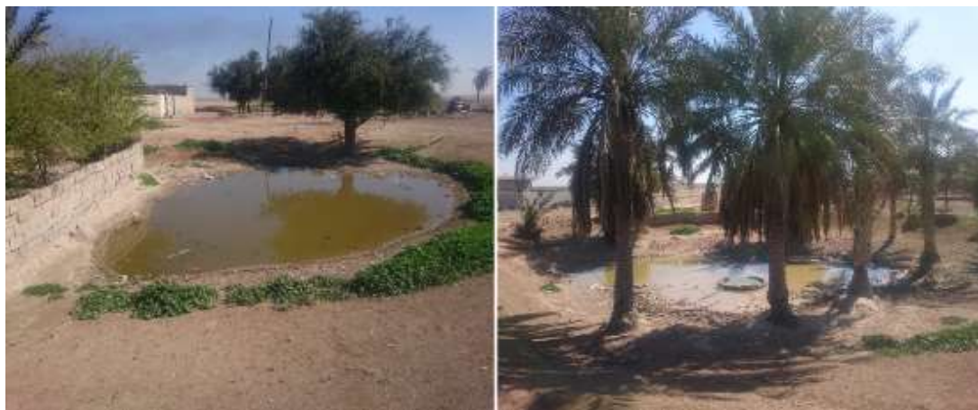
شکل (۵): گوراب دایره‌ای شکل کوچک برای تامین آب نخيلات و درختان غيرمثمر در سطح کوچک