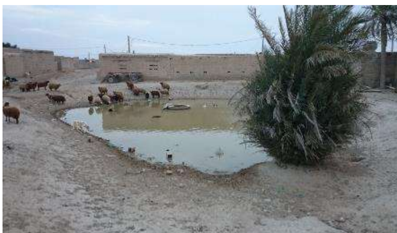
شکل (۴): گوراب دایره‌ای شکل متوسط برای تامین آب شرب دام - روستای شریفیه جنوب شرق اهواز

این گوراب‌ها که با هدف تامین آب برای دام و حیوانات خانگی حفر می‌گردند عمدتاً در کنار روستا ایجاد شده و به شیوه‌ای طراحی و احداث می‌شوند که بخشی از آن شیب خیلی کمی داشته و دام به راحتی بتواند از آب ذخیره شده در داخل آن استفاده کند. شکل (۴) یک نمونه گوراب دایره‌ای شکل متوسط را نشان می‌دهد.