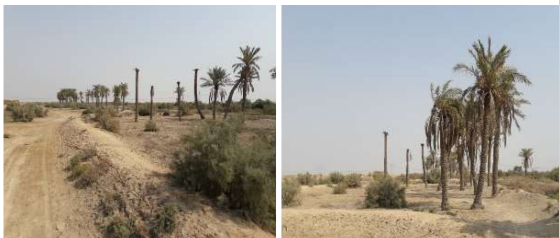
شکل (۶): گوراب مربعی شکل با هدف تامین آب برای احداث نخلستان - پایین دست روستای غیزانیه کوچک - شهرستان اهواز

این دسته از گوراب‌ها عمدتاً بزرگ هستند و با هدف تامین آب برای احداث نخلستان ایجاد شده و نحوه طراحی و ساخت آن‌ها به این صورت است که پس از تعیین محل مناسب احداث، عملیات گودبرداری خیلی کمی داشته و خاک حاصل از آن صرف احداث خاکریز دور آن می‌گردد که این خاکریز حدود یک متر ارتفاع دارد و با توجه به سطح بزرگی که دارند این قابلیت را دارند که حجم زیادی رواناب به داخل گوراب هدایت شده و همچنین بارش وارد بر آن سطح نیز در داخل آن محفوظ می‌ماند. بعضی از این گوراب‌ها در حاشیه رودخانه‌ها احداث می‌گردند و به شیوه‌ای طراحی می‌شوند که توسط یک کانال انحرافی دست‌ساز مقدار قابل توجهی از آب رودخانه را به درون گوراب هدایت و ذخیره می‌کنند و به نوعی نخلستان به شیوه غرقابی آبیاری می‌شود (شکل ۶).