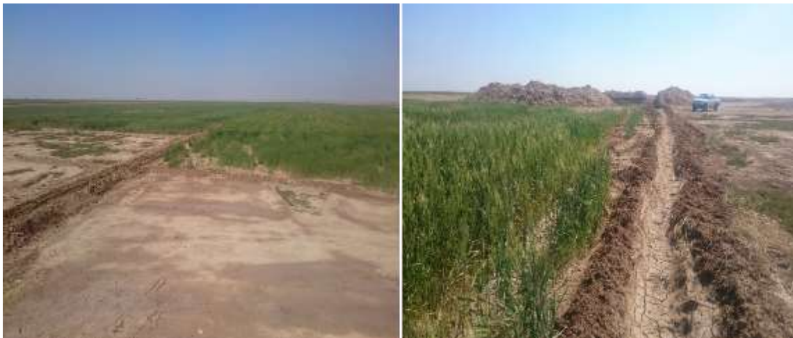
شکل (۱۰): زراعت و آبیاری گندم با استفاده از گوراب مستطیل شکل در پایین دست روستای شریفیه

هزینه و سرانه مصرف آب یک خانوار دامدار در روستای غدیرحبسه