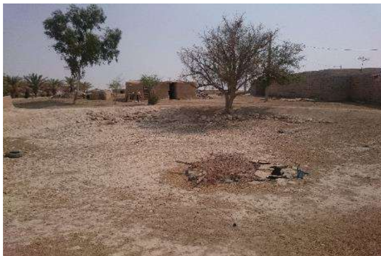
شکل (۳): گوراب دایره‌ای شکل بزرگ با هدف تغذیه چاه - وسط روستای زوینه - شهرستان ماهشهر