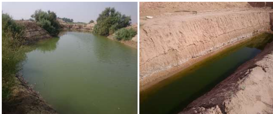
شکل (۷): گوراب مستطیل شکل

تصویر سمت راست روستای گسوان شهرستان باوی - تصویر سمت چپ روستای حماد شهرستان ماهشهر