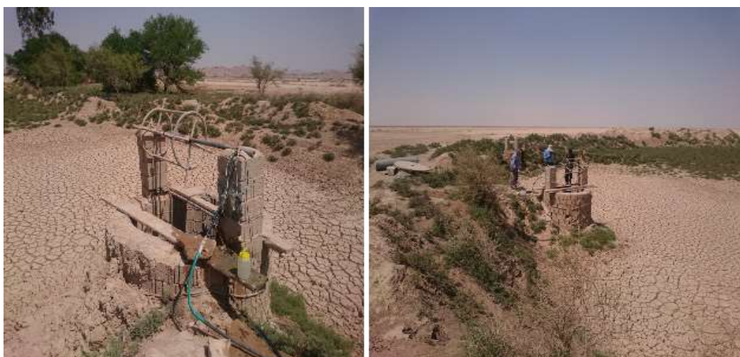
شکل (۲): گوراب دایره‌ای شکل بزرگ با هدف تغذیه چاه- حاشیه روستای دهنو- شهرستان هندیجان

این دسته از گوراب‌ها عمدتاً در بیرون از روستاها ولی نزدیک به آن احداث می‌گردد و معمولاً یک یا دو چاه بهره‌برداری در مرکز ثقل تجمع رواناب‌ها و یا کناره‌های داخلی گوراب حفر می‌گردد. برای جلوگیری از پرشدن چاه از رسوبات، دهانه چاه را حدود نیم تا یک متر دیوارچینی کرده و از کف گوراب بالاتر می‌سازند. همچنین نحوه برداشت آب از چاه به شیوه دستی (سطل و طناب)، چرخ دستی و یا با نصب موتور پمپ برقی می‌باشد. البته انتخاب مکان این چاه‌ها بستگی به زمان و فصل بهره‌برداری و نوع استفاده از آب چاه دارد. مثلاً در گوراب‌های دایره‌ای شکل بزرگ حاشیه روستا، چاه را در کناره‌های داخلی گوراب حفر می‌کنند که به راحتی در فصول مختلف سال دسترسی به آن راحت و امکان استفاده از آن وجود داشته باشد (شکل ۲).