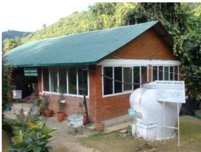
شکل . نمونه سیستم استحصال آب باران با کوزه تایلندی

دارد که طی آن آب آشامیدنی بایستی از کوزه تامین شود و کوزه‌هایی با ظرفیت ۲۰۰۰ لیتر برای یک خانوار کافی است (UN-HABITAT, 2005).