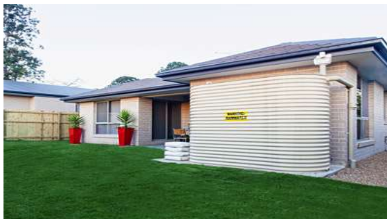
شکل (۲): نمونه‌ای از نصب مخازن جدید استحصال آب باران در خانه‌های استرالیایی