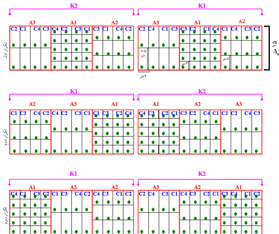
شکل (۲): شکل شماتیک نحوه اجرای تیمارهای طرح