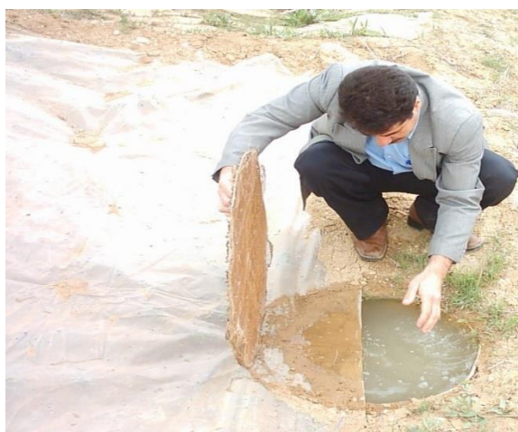
شکل (۴): تجمع آب در بشکه ناشی تیمار C3

ضریب رواناب سطوح آبخیز تأثیر زیادی در مقدار آب جاری شده به پای درخت و نفوذ یافته در پروفیل خاک دارد. شیب‌بندی و نوع سطح آبخیز از عوامل مؤثر در میزان ضریب رواناب است. شیب‌بندی برای تمام تیمارها به صورت یکنواخت انجام گرفت اما وجود چهار نوع آماده‌سازی برای وضعیت سطوح رواناب منجر به بروز تغییرات در ضریب رواناب شد. برای محاسبه ضریب رواناب در تیمارهای وضعیت سطوح رواناب، اقدام به تعبیه چهار عدد بشکه در پایین دست چهار حوضه گردید. نحوه اندازه‌گیری بدین ترتیب بود که بلافاصله پس از وقوع هر بارش، نسبت به اندازه‌گیری میزان بارندگی به وسیله حجم آب جمع شده در بشکه‌ها اقدام شد و با تقسیم عمق رواناب به عمق بارندگی از باران‌سنج موجود در روستا، ضریب رواناب محاسبه شد. شکل (۴) تجمع آب در بشکه ناشی از تیمار C3 را نشان می‌دهد.