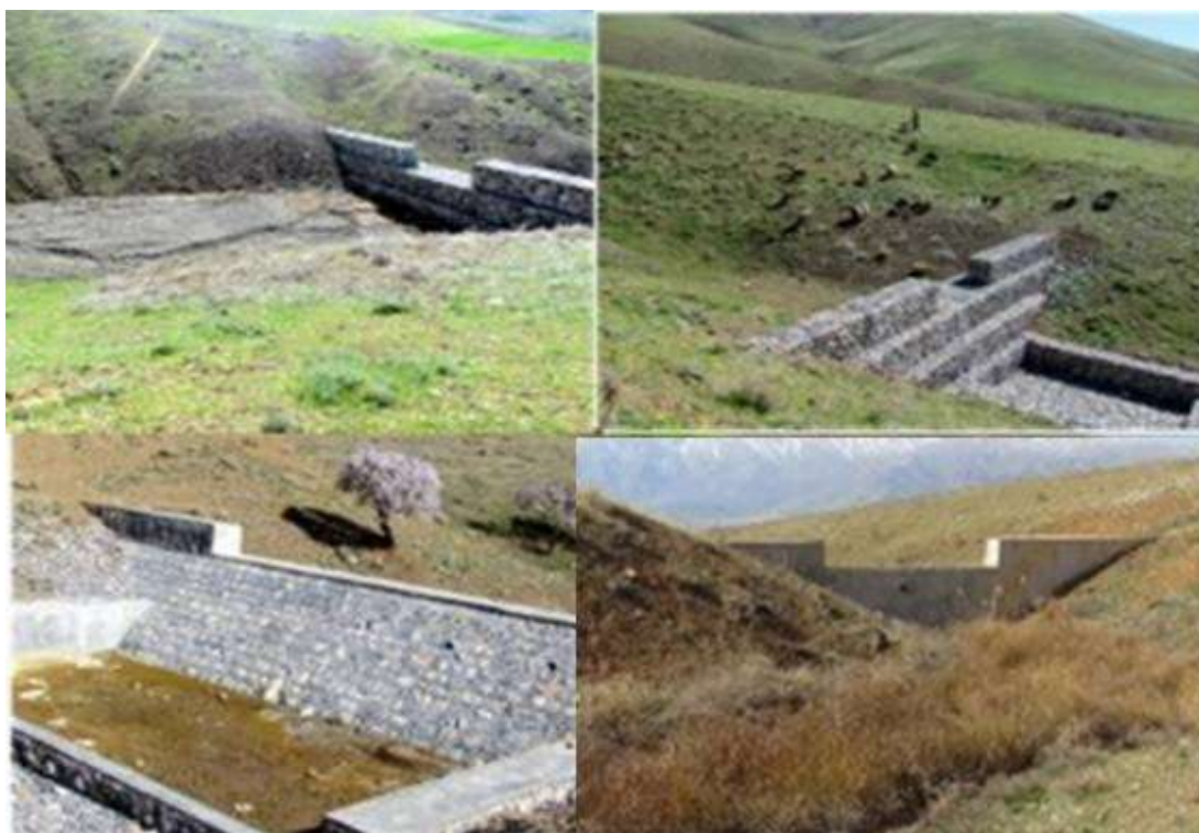
شکل (۴): نمونه بندهای رسوب‌گیر سنگی ملاتی و گابیونی در محدوده آبراهه‌های روستای قشلاق حوضه رزین