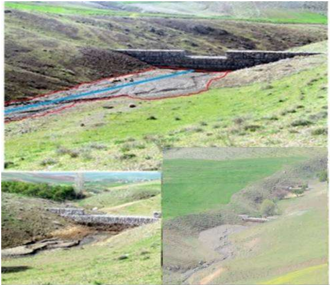
شکل (۶): تصویری از رسوبات جمع شده پشت ۳ بند مورد ارزیابی در حوضه رزین

در شکل (۶) سیمایی از رسوبات جمع شده در پشت بندهای احداثی ونحوه ترسیم حجم و ابعاد آنها نشان داده شده است.