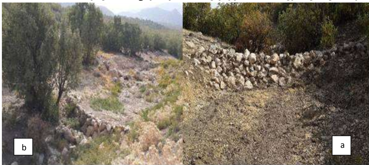
شکل (۲): (a) نمایی از رسوب پشت بند و (b) موقعیت بند در آبراهه در حوضه مرگ

در حوضه مرگ در مجموع ۲۰ بند خشکه‌چین بررسی شد. تعداد هشت بند از این بندها، فاقد رسوب بود. اما، دو بند که در انتهای آبراهه و در اراضی کشاورزی دیم احداث شده بودند، از رسوب انباشته بود. تعداد ۱۱ قطعه بند در یک آبراهه و در توالی هم دارای ظرفیت رسوب‌گیری بود و در این پژوهش مورد بررسی قرار گرفتند که تصاویری از آنها در شکل (۲) نشان داده شده است. متوسط طول بندهای خشکه‌چین هفت متر، عرض آنها ۱/۵ متر و ارتفاع آنها یک متر، متوسط شیب آبراهه مورد نظر ۷/۴ درصد بود. بندهای مورد ارزیابی در حوضه آبخیز حاجی‌آباد عبارت بودند از: تعداد ۴ بند گابیونی و ۱۰ بند خشکه‌چین بود (شکل ۳). ابعاد سازه‌های گابیون در حوضه حاجی‌آباد متغیر و به طول بین ۵ تا ۲۷ متر و عرض متوسط ۴ متر احداث گردیده‌اند. ارتفاع این گابیون‌ها بین ۴/۲ تا ۴/۵ متر می‌باشد همچنین عرض پائین دست این سازه‌ها بین ۶/۲ تا ۸ متر و طول این بخش از سازه بین ۱۳ تا ۱۶/۵ متر متغیر است. همچنین، ابعاد سازه‌های چکدم خشکه‌چین احداثی متغیر و با طول بین ۱/۵ تا ۳۰ متر و عرض ۰/۸ تا ۳/۶ متر و همچنین ارتفاع این چکدم‌ها از ۰/۲۵ تا ۳ متر متغیر است. بیشتر این چکدم‌ها در پائین دست نیز جهت ممانعت از شستشوی خاک زیر بند و افزایش ماندگاری و استحکام بند، سنگ‌چین شده است و ابعاد این بخش با طول ۱/۵ تا ۱۹/۲ متر و عرض ۰/۸ تا ۳ متر متغیر می‌باشد (شکل ۲ و ۳).