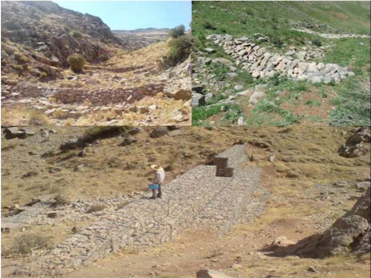
شکل (۳): تصویری از سازه‌های چکدم (بالا) و گابیونی (پائین) حوزه آبخیز حاجی اباد کنگاور

مصادیق بندهایی که در این مطالعه در حوزه رزین و در محدوده روستای قشلاق ارزیابی شدند تعداد ۱۰ بند رسوب‌گیر گابیونی و ۴ بند رسوب‌گیر سنگی ملاتی بود. مشخصات و ابعاد فنی سازه‌های احداث شده در دسترس نبود و در شکل (۴) چند نمونه از بندهای یاد شده نشان داده شده است. از مجموع بندهای ارزیابی شده فقط رسوبات قابل اندازه‌گیری در پشت سه بند وجود داشت و در بقیه رسوب قابل اندازه‌گیری نبود. زمان مطالعه حاضر در سال‌های ۱۳۹۷ و ۱۳۹۸ بود و از عمر استقرار بندها ۷ تا ۱۰ سال گذشته بود