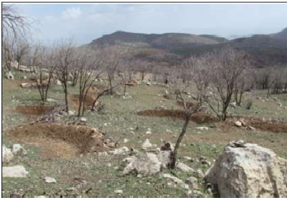
شکل (۲): ابعاد و فاصله بانکت‌های هلالی ذخیره رواناب سطحی در پلات‌های جنگل بلوط

این پژوهش در قالب طرح آزمایشی بر پایه بلوک‌های کامل تصادفی با چهار تیمار بانکت و قرق، قرق، بانکت بدون قرق و شاهد با سه تکرار مورد آزمایش قرار گرفت. کرت‌ها (پلات‌های ثابت) به ابعاد ۳۰×۵۰ متر با فاصله جانبی ۱۰ متر به موازات هم جهت دامنه تعبیه شدند تا اثرات رطوبتی پلات‌ها بر یکدیگر حذف گردد. اطراف هر کرت با استفاده از سنگ و خاک به شکل پشته ماندی محصور گردید (شکل ۲).