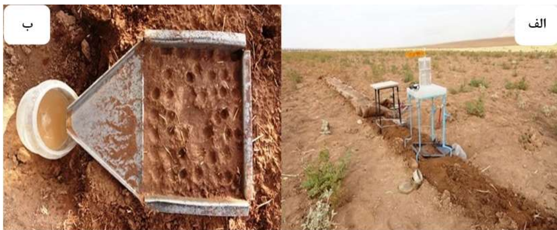
شکل (۳): تصاویری از آزمایش در منطقه سرارود،

الف: نمایی از محدوده مورد آزمایش ب: سطح خاک پس از آزمایش در شیب ۱۲ درصد