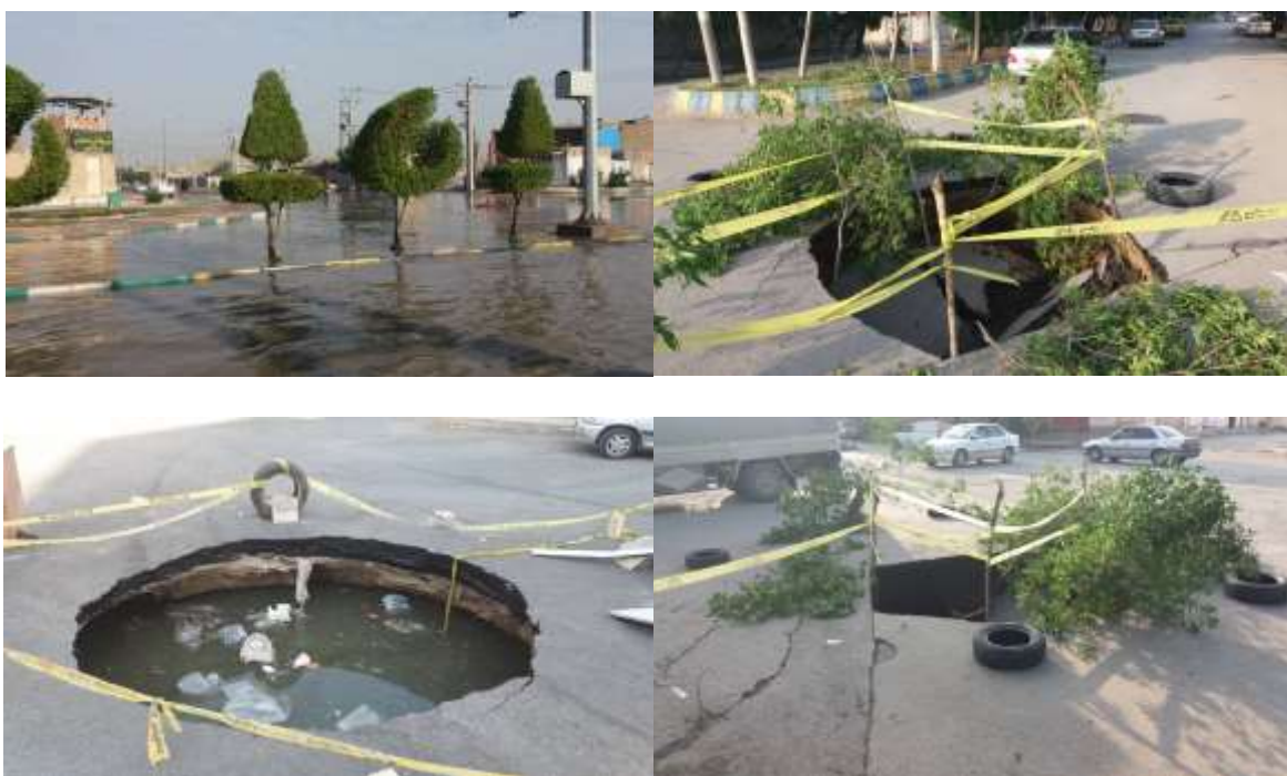
شکل (۱): نمونه‌ای از ریزش خطوط و آب‌گرفتگی معابر در اهواز

گردیده و به دلیل حجم بالای رواناب و مواد، رسوبات، آشغال و شاخ و برگ همراه آن دفع فاضلاب را نیز با مشکل مواجه می‌نماید و طبق تجربه چندین روز پس از بارندگی همچنان شاهد آب‌گرفتگی معابر خواهیم بود. بر اساس برخی از اصول هیدرولیکی و جهت هدایت گازهای خورنده و بخارات اسیدی تولیدشده و نیز در نظر گرفتن ضریب اطمینان لازم، حداکثر درصد پرشدگی مجاز لوله‌های فاضلاب با توجه به قطر لوله بین ۶۰ الی ۸۰ درصد می‌باشد که در طرح جامع فاضلاب اهواز با یک ضریب اطمینان بالاتر این مقادیر کمتر در نظر گرفته شده است. باین‌حال به دلیل فرسوده بودن خطوط و پرشدگی کامل خطوط در هنگام بارندگی در بسیاری از مواقع تاج لوله‌ها دچار خوردگی و ریزش می‌شود. در شکل (۱) نمونه‌ای از آب‌گرفتگی و ریزش خطوط فاضلاب نمایش داده شده است.