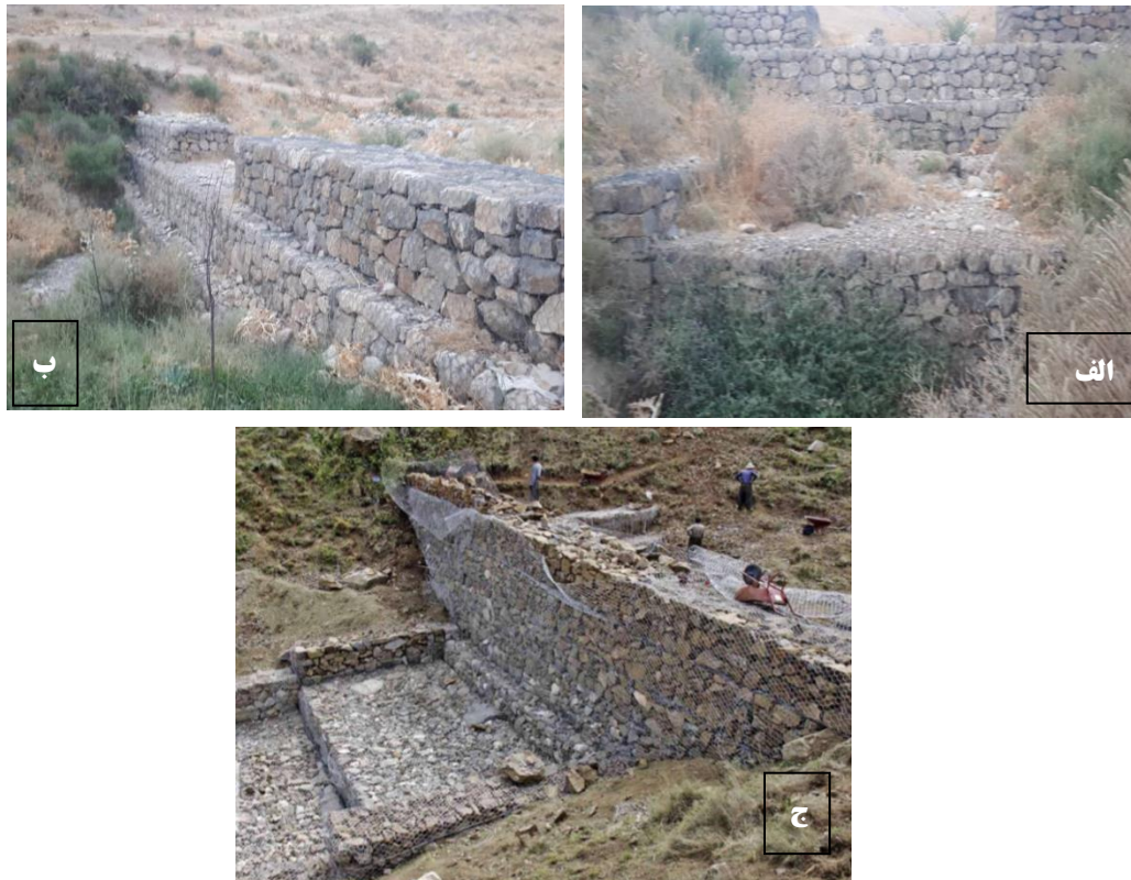
شکل (۲): سازه‌های مکانیکی سرریز پلکانی و حوضچه پایین‌دست احداثی (الف)، تاج سرریز توری‌سنگی و مقطع عرضی آبراهه (ب) و عملیات اجرایی سازه توری‌سنگی (ج)