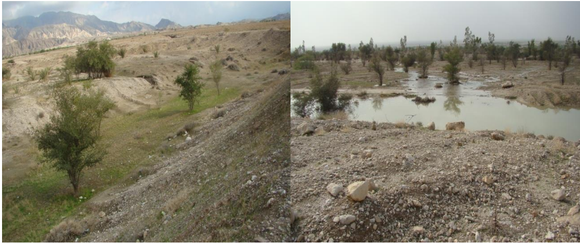
شکل (۲): جنگل دست کاشت و بهبود وضعیت پوشش گیاهی عرصه پخش سیلاب