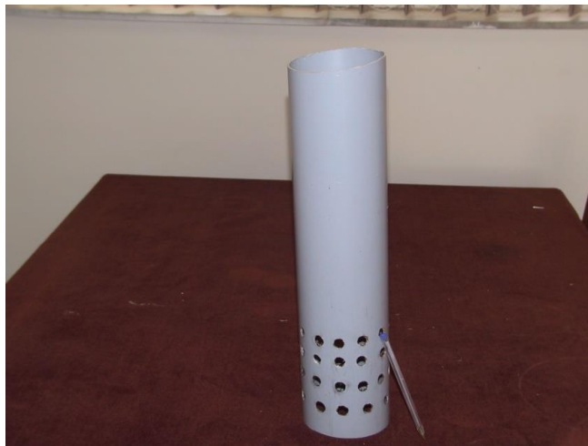
شکل ۳- نمونه‌ای از لوله پلی‌اتیلن که برای ساخت فیلتر سنگریزه‌ای به کار برده شده است Figure 3- An example of a polyethylene pipe used to make a gravelly filter