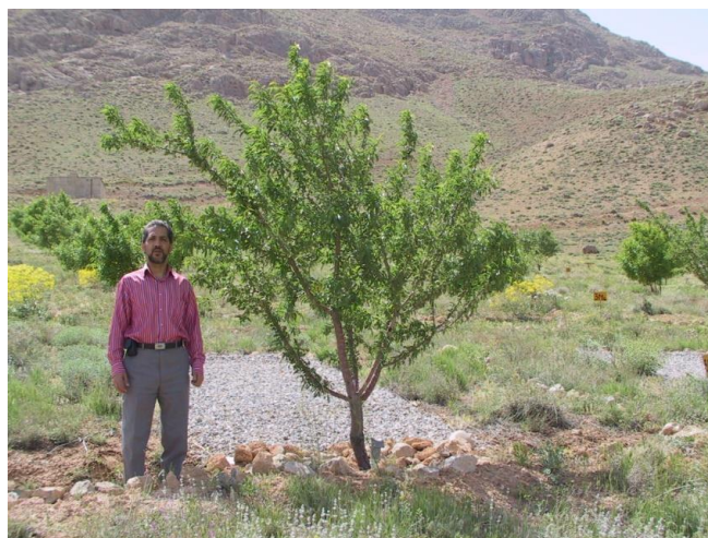
شکل ۱۰- رشد و نمو درخت بادام در تیمار عایق همراه با فیلتر سنگریزه‌ای