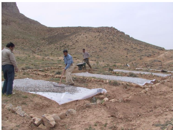
شکل ۵- عایق نمودن سطح سامانه آبیگر با استفاده از پلاستیک و سنگریزه Figure 5- Insulating the surface of microcatchment using plastic and gravel