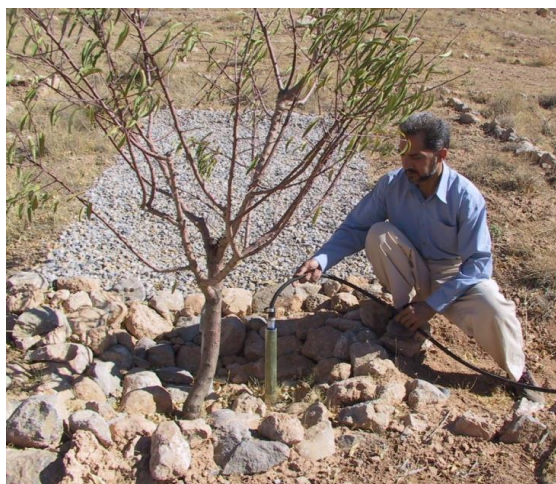
شکل ۹- اندازه‌گیری درصد رطوبت حجمی خاک با استفاده از دستگاه TDR Figure 9- Measurement of soil moisture percentage using TDR device

۱۱- شاخص‌های گیاهی شامل قطر بقیه، ارتفاع درخت، سطح تاج پوشش و تولید میوه برای هر یک از ارقام بادام اندازه‌گیری شد. ۱۲- تجزیه و تحلیل آماری داده‌ها با استفاده از نرم‌افزار SPSS صورت پذیرفت. برای مقایسه میانگین داده‌های رطوبت خاک در تیمارهای مختلف و دسته‌بندی آن‌ها از آزمون چند دامنه‌ای دانکن ۱ استفاده شد. همچنین، به منظور تعیین تفاوت بین تیمارهای مشابه و همسان در حالت با فیلتر سنگریزه‌ای و بدون فیلتر سنگریزه‌ای و مشخص نمودن نقش فیلترها در ذخیره رطوبتی خاک، از آزمون T جفت شده ۲ استفاده شد.