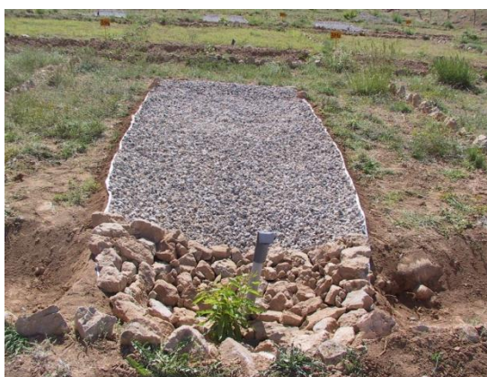
شکل ۶- نمایی از تیمار سامانه آبیگر عایق پس از کاشت نهال بادام Figure 6- A view of the isolated surface treatment after planting almond seedling