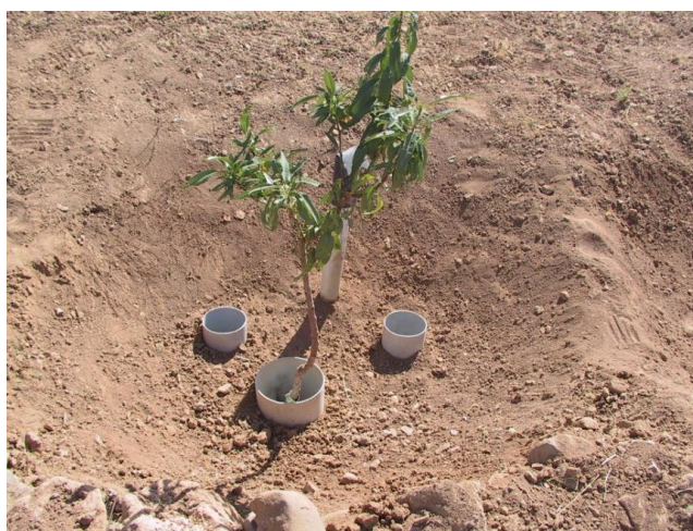
شکل ۴- جانمایی فیلتر در چاله کشت نهال قبل از ریختن سنگریزه در آن Figure 4- Placement of the filter in the seedling hole before pouring gravel in it