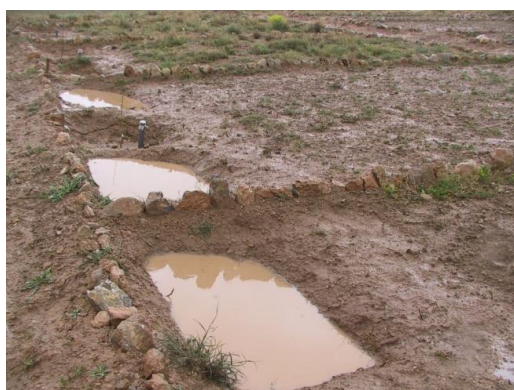
شکل ۸- وضعیت ذخیره رواناب در بانکت‌های احداث شده در دو طرف چاله نهال

K_a : ثابت دی‌الکتریک ظاهری (مخلوط خاک و رطوبت)، t : زمان حرکت موج الکترومغناطیس از ابتدا تا انتهای میله هادی (نانو ثانیه)، C : سرعت حرکت نور (سانتی‌متر بر نانو ثانیه)، L : طول میله هادی (سانتی‌متر)