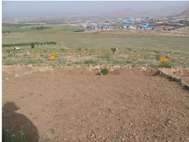
شکل ۲- تیمار جمع‌آوری پوشش گیاهی سطح سامانه (زمین تمیز شده) Figure 2- Vegetation collection treatment (removed surface)