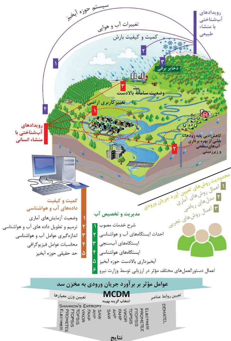
شکل ۲- مدل مفهومی معیارها و گزینه‌های مؤثر در تخمین ورودی میزان آب به سدهای مخزنی و روش‌های به کار رفته در این پژوهش Figure 2- Conceptual model of effective criteria and options in forecasting water inflow to the reservoir dams and the methods used in this research

ایجاد رواناب، شرایط خاص زمین‌شناسی، پوشش گیاهی، حد واقعی حوضه آبخیز، توان آب‌های زیرزمینی، بازخورد و عملکرد تاریخی حوضه و واکنش آن نسبت به بارش‌های با شدت و مدت مختلف، شناخت رژیم بارش و رودخانه‌های فصلی و غیرفصلی نقش تعیین‌کننده‌ای دارد (شمسایی، ۱۳۹۰).