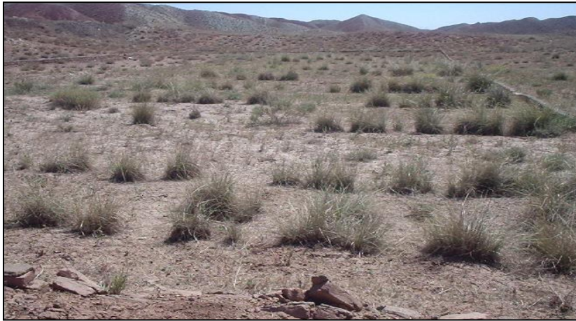
شکل ۵- تیمار کنتورفارو بعد از کاشت گیاه آگروپیرون النگاتوم