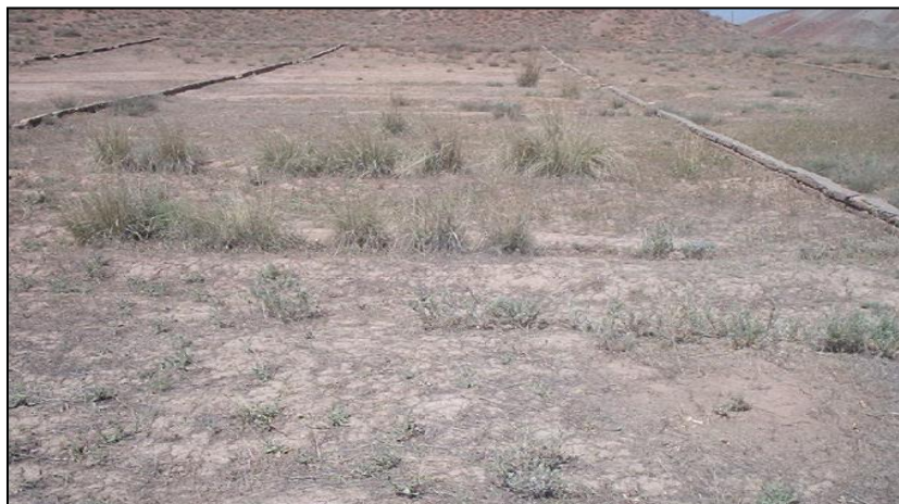
شکل ۴- وضعیت تیمار شاهد بعد از کاشت گیاه آگروپیرون النگاتوم