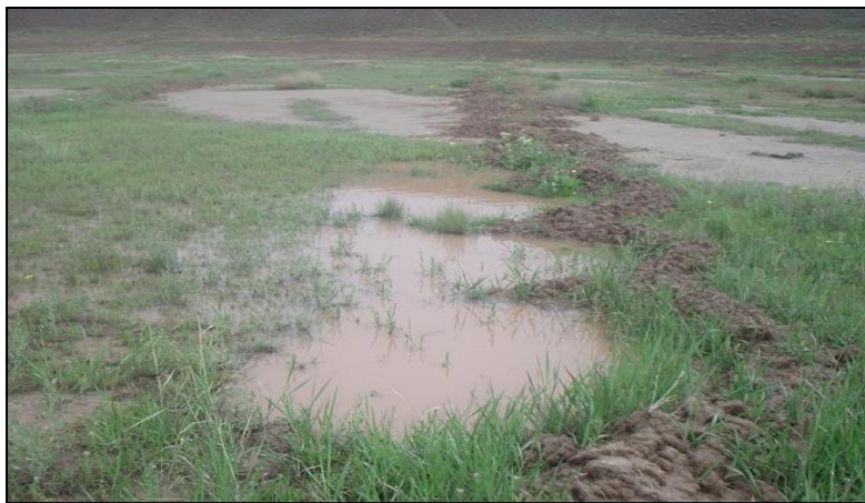
شکل ۳- تیمار میکروکچمنت با پوشش گیاهی