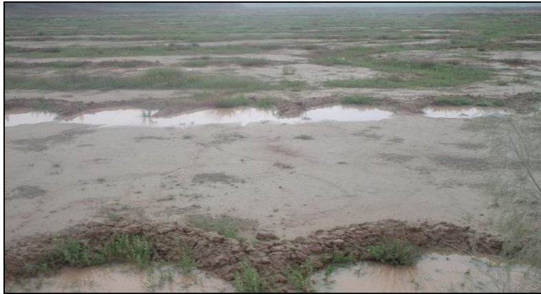
شکل ۲- تیمار میکروکچمنت قبل از کاشت گیاه آگروپیرون النگاتوم