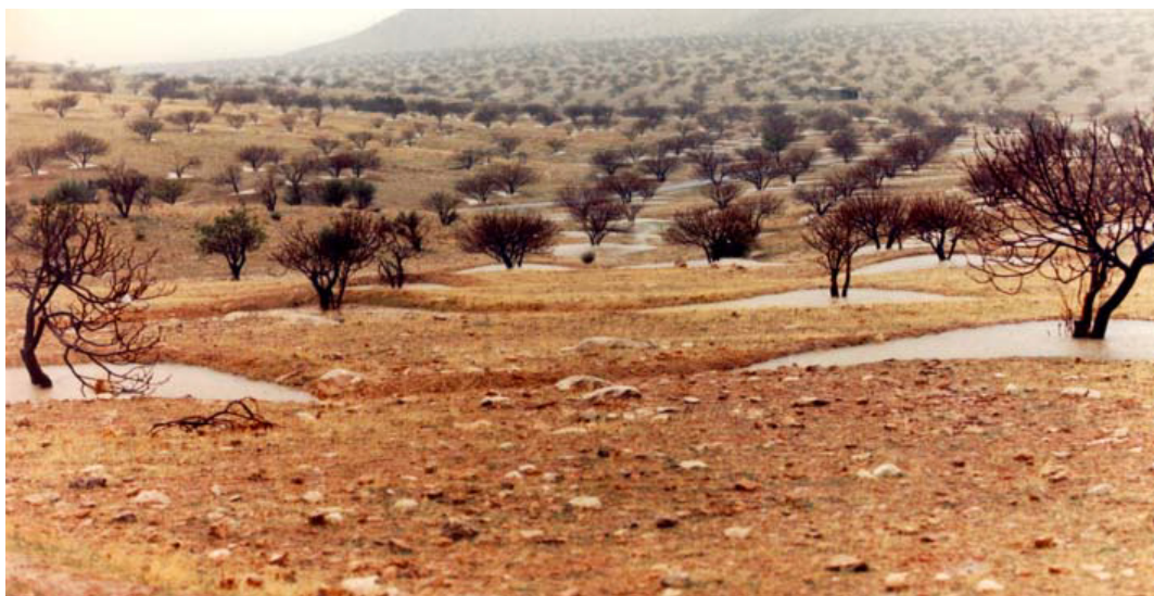
شکل ۷- نمایی از "انجیرستان دیم" حوضه استهبان - مرکز شرقی فارس (مصباح، ۱۳۸۸)

دو میلیون اصله انجیر دیم در وسعت ۲۳۰ کیلومتر مربعی در شهرستان استهبان فارس با دانش بومی بهره‌برداری از آب باران و رواناب حاصل از آن گنجینه ارزشمند و فوق‌العاده‌ای را در منطقه خشک جنوب کشور ایجاد کرده است. جمع‌آوری آب باران از آبخیزهای کوچک تقریباً ۱۰۰ متر مربعی، ایجاد نوار و پشته‌های جمع‌آوری هرزآب، سکوبندی و جمع‌آوری آب باران، انحراف آبراهه‌های کوچک با دهانه آبیگر ساده و هدایت آب به پای درخت انجیر از روش‌های آبیاری انجیرستان‌های دیم است. حوضه شهری حدود ۲۴۰ کیلومتر مربعی استهبان سالانه حدود چهار میلیون مترمکعب سیلاب دارد؛ با توجه به انجیرستان‌های موجود در این حوضه، حدود ۲۰ درصد این سیلاب صرف آبیاری آن‌ها می‌شود (شکل ۷).