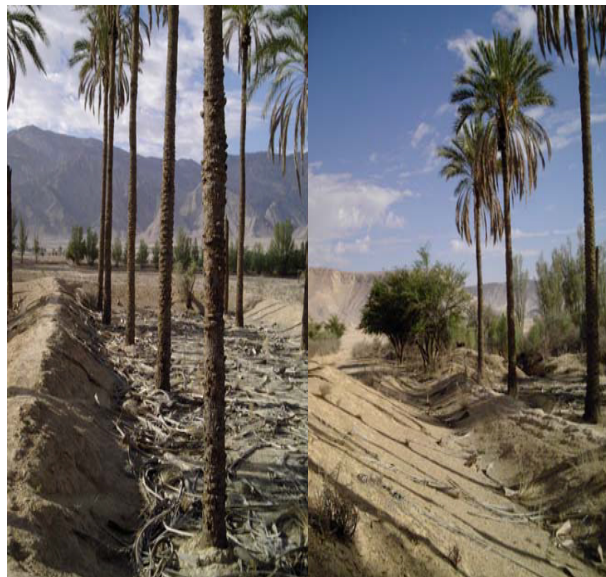
شکل ۶- نمایی از "بست" یا نخلستان سیلابی حاشیه شهر گراش - جنوب فارس (مصباح، ۱۳۸۸)

در دو طرف مسیل اصلی شهر گراش فارس دهانه‌های آبیگر متوالی احداث شده و نخلستان‌های حاشیه آن که به آن‌ها "بست" گفته می‌شود، آبیاری سیلابی می‌شوند. خاکریزهای اطراف مسیل ساده و به ارتفاع ۱/۵ متر هستند. هرچند به دلیل تنوع و گوناگونی مقدار باران و سیل، هر ساله نخلستان پر محصول و پردرآمد نیست، ولی نقش مهمی، از ایجاد فضای سبز گرفته تا مهار سیل و رسوب در منطقه دارند. حدود ۷۰ درصد سیلاب این مسیل صرف آبیاری همین "بست‌ها" یا نخلستان می‌شود (شکل ۶).