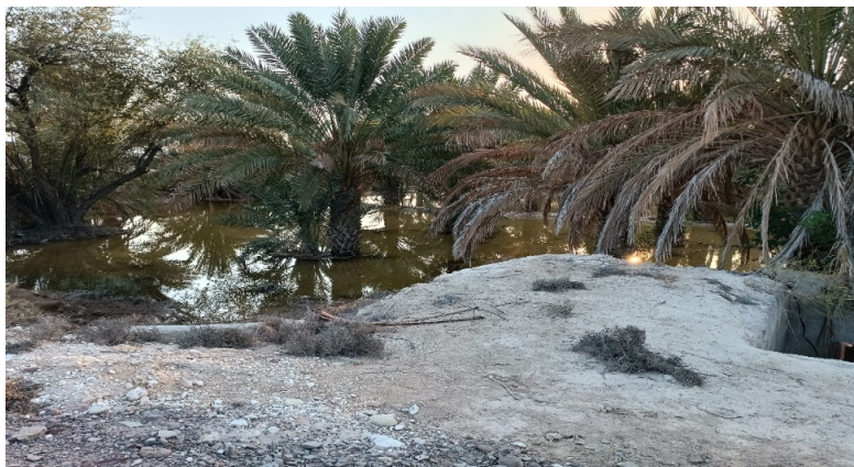
شکل ۱۱- ایجاد نخلستان با استفاده از سیلاب. گزیر و بندر لنگه (حسینی مرندی، آذر ۱۴۰۲) Figure 11- Construction of a palm garden using floods. Gezir, and Bandare Lengh, (Hosseinimrandi, November 2023)

در مناطق زیادی از دشت‌های ساحلی خلیج فارس تا دریای عمان کشت‌های زراعی و باغی غالباً با استفاده از سیلاب و رواناب‌های زمستانه و حتی تابستانه انجام شده و آبیاری می‌شوند. آب زیرزمینی در این مناطق یا وجود ندارد و یا بسیار شور و برای کشاورزی غیر قابل استفاده است. زمین‌های کشت شده و یا باغ شده با این روش‌ها به نام‌های مختلف محلی شناخته می‌شوند (شکل ۱۱).