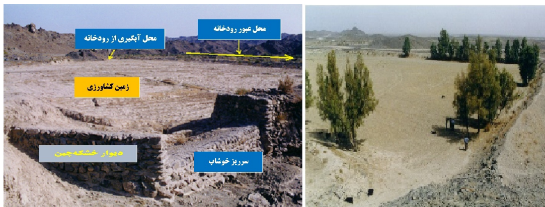
شکل ۴- دو نمونه خوشاب آماده کشت سیلابی، سراوان و سیستان و بلوچستان (حسینی مرندی، ۱۳۸۰)

خوشاب در حاشیه رودخانه‌ها، دره‌ها، دشت‌های دامنه‌ای و در میان تپه ماهورها احداث می‌شود و اجزاء مهم آن شامل: دیواره سنگی یا خاکی، بند یا کف‌بند، نهر سیلاب‌رسان، دروازه سیلاب‌گیر، سرریز، دریچه تخلیه و زمین کشاورزی هستند. به‌وسیله دست و با دانش بومی مردم ساخته می‌شوند و از چهار دهم هکتار تا دو نیم هکتار مساحت دارند (شکل ۴).