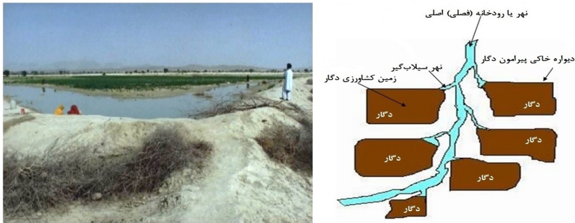
شکل ۲- سامانه سنتی دگار، دشتیاری، چابهار و بلوچستان. راست: شماتیک دگارهای متوالی، سمت چپ: کشت سیلابی دگار (حسینی مرندي، ۱۳۸۰)

زمینی کاملاً مسطح و چند هکتاری است که در دشتیاری چابهار بلوچستان کاملاً شناخته شده است. اساس کشاورزی سیلابی مردم منطقه بر روی این نوع زمین است. با دیواره‌های کوتاه (کم‌تر از یک متر) بیش‌تر به شکل مربع مستطیل و مربع مستطیل محصور و با توجه به رسی و لای بودن خاک ده‌ها روز آب را بر سطح خود نگه می‌دارند (شکل ۲). کشت در زمین دگار تقریباً با یک سیلاب به محصول می‌نشیند. بخشی از اقتصاد خانوارهای بومی روستایی این منطقه بر آن استوار است.