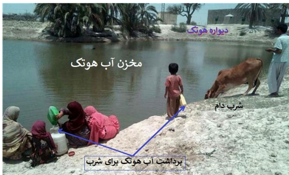
شکل ۳- سامانه هوتک، دشتیاری، چابهار و بلوچستان (ایرنا، ۱۴۰۲)