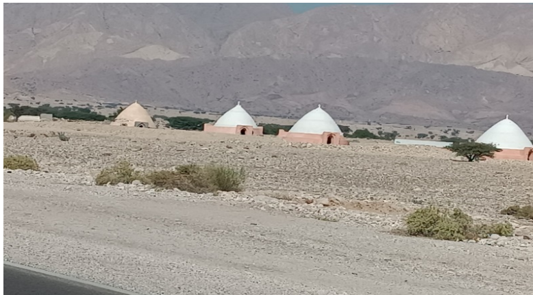
شکل ۹- نمایی از "آب انبار" جنوب لارستان - جنوب فارس (حسینی مرنندی، آذر ۱۴۰۲)

در مناطق خشک جنوب ایران احداث آب انبار برای جمع‌آوری و هدایت آب باران و رواناب درون آن‌ها مرسوم است. یکی از شاخص‌های شناخت محیط طبیعی مناطقی در استان فارس از شهرهای خنج، اوز، گراش، مهر، لامرد و لارستان تا بندر لنگه و بندرعباس آب انبارها هستند. آب انبارها درون شهر، روستا، حاشیه مسیر جاده و راه‌ها و در اراضی کشاورزی احداث شده و غالباً توسط اشخاص خیر ساخته می‌شوند. شکل گنبدی، سطح مقطع مدور یا مستطیلی و مصالح ساروجی در ساخت آن‌ها، تاسیسات ساده جمع‌آوری و هدایت آب به درون آب انبار، و تاسیسات ساده برداشت آب از نمودهای دیدنی آب انبارهای این منطقه است (شکل ۹).