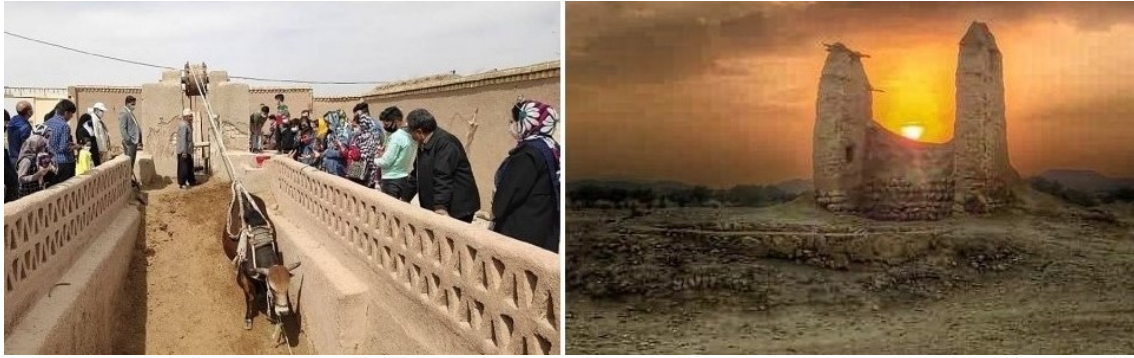
شکل ۸- سمت چپ: گاوپناه فعال در روستای ورزانه اصفهان، آثار گاوپناه قدیمی در جنوب غربی خنج فارس