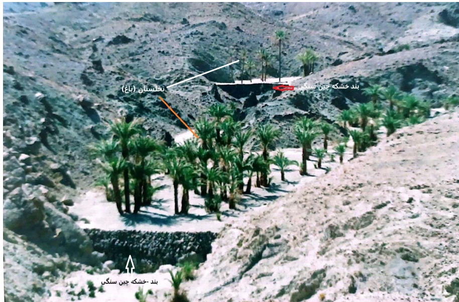
شکل ۵- دربندهای متوالی در طول دره کوهستانی، چانف، نیکشهر و بلوچستان (حسینی مرندی، ۱۳۸۰)

زمین قابل کشت سیلابی نخل و گاهی زراعت احداث می‌شود. دربندها انواع گوناگونی دارند که گاهی با نام و نشان‌های مختلف محلی نیز شناخته می‌شوند (شکل ۵).