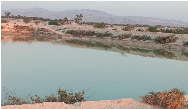
شکل ۱۰- سیلاب جمع شده (زالال) و آماده فروریزش به درون چاه حاشیه حوضچه. گزیر و بندر لنگه (حسینی مرندی، آذر ۱۴۰۲) Figure 10- The flood is collected and ready (Clearwater) to collapse into the well on the pond's edge. Gezir, and Bandare Lengh (Hosseinimrandi, November 2023)