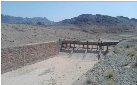
شکل ۶- دهانه آبیگر جانبی با زاویه ۹۰ درجه ساخته شده در رودخانه نای در آبخوان کاشمر Figure 6- A 90-degree lateral Intake Span built on the Nay River on the Kashmar aquifer