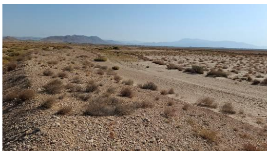
شکل ۸- رسوب‌گذاری زیاد در کانال آبرسان گسترشی سوم در سامانه پخش سیلاب بر آبخوان جاجرم Figure 8- High Sedimentation in the third expansion floodwater supply channel of the FWSS on the Jajarm aquifer