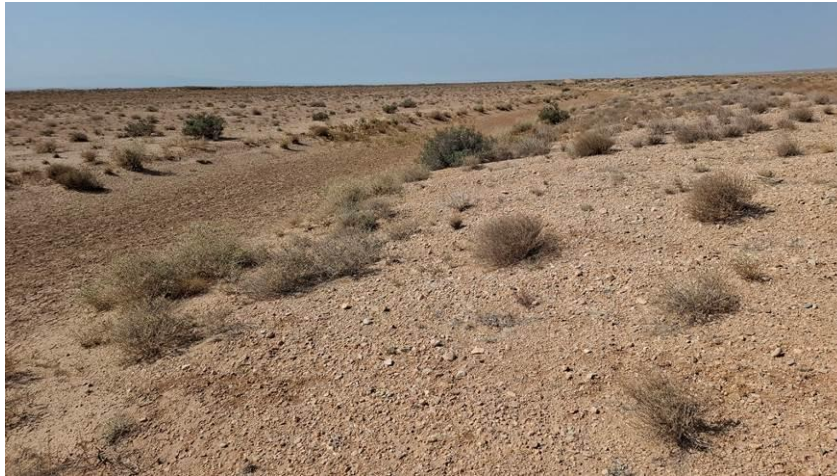
شکل ۴- سیستم لبه پخش (کاملاً پایدار و کارا) در عرصه پخش سیلاب بر آبخوان جاجرم