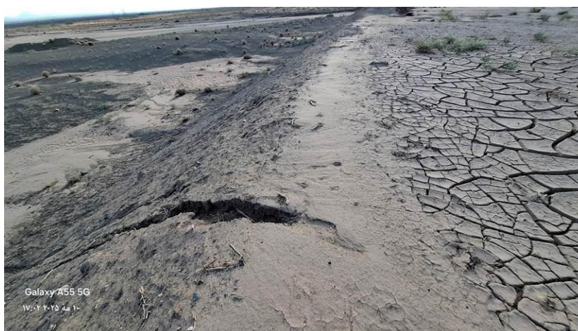
شکل ۹- رسوب‌گذاری زیاد در نهر آبرسان سامانه پخش سیلاب بر آبخوان سبزواری Figure 9- High Sedimentation in the main floodwater transfer channel of the FWSS on the Sabzevar aquifer