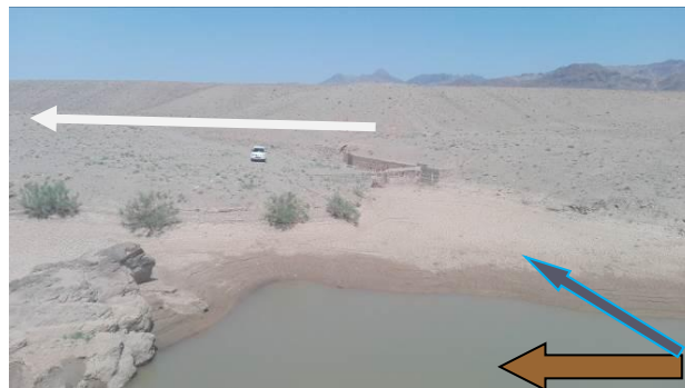
شکل ۵- موقعیت دهانه آبیگر نسبت به مخزن بند انحرافی در رودخانه نای در آبخوان کاشمر Figure 5- The position of the Intake Span relative to the diversion dam reservoir in the Nay River on the Kashmar aquifer