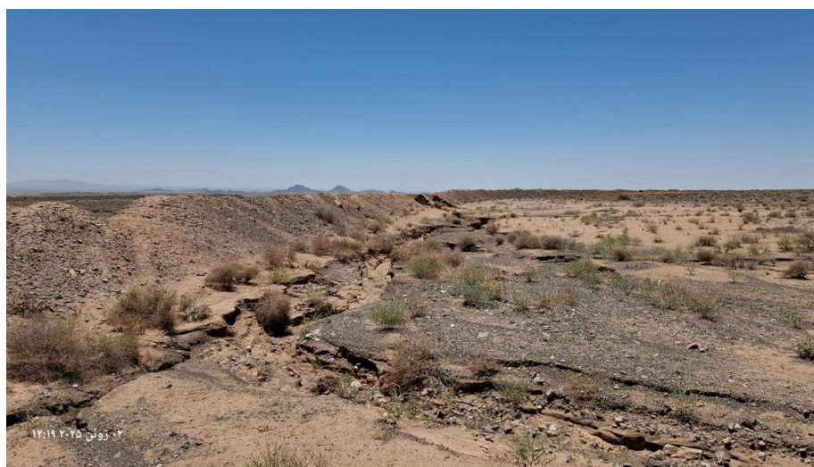
شکل ۳- فرسایش آبکندی واقع در عرصه پخش سیلاب بر آبخوان سبزوار Figure 2- Gully erosion located in the floodwater spreading area on the Sabzevar aquifer