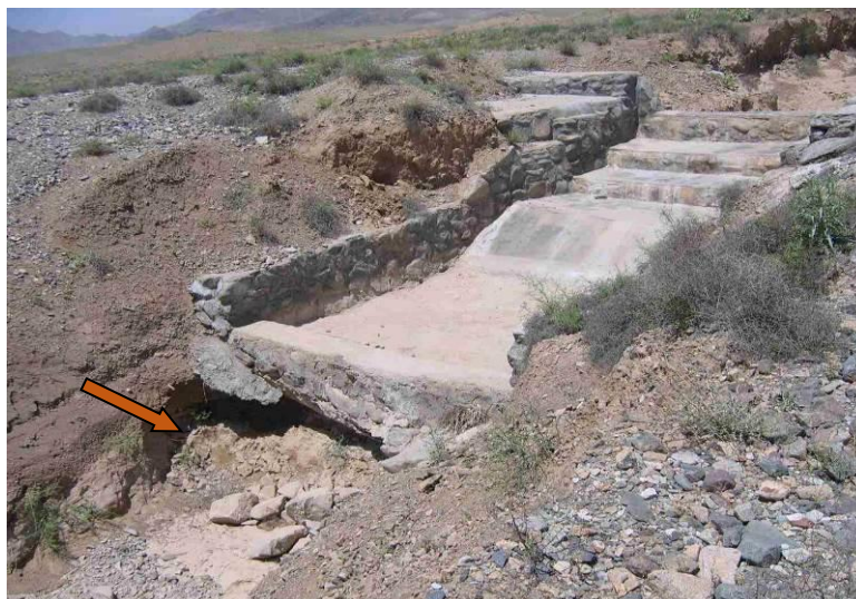
شکل ۱۰- پدیده آب‌شستگی پایین دست شیب‌شکن سامانه پخش سیلاب بر آبخوان کاشمر Figure 10- Scours phenomenon downstream of the drop of the FWSS on the Kashmar aquifer