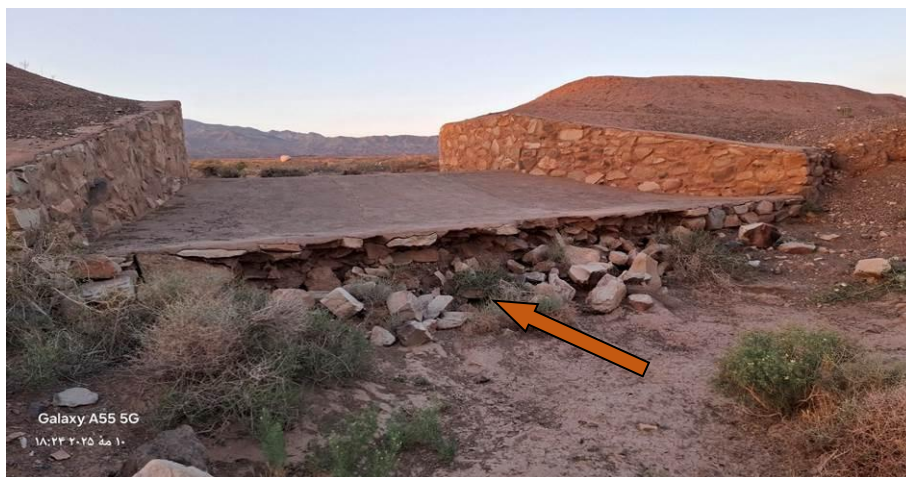
شکل ۱۱- پدیده آب‌شستگی پایین دست دروازه عبور جریان در سامانه پخش سیلاب بر آبخوان سبزوار Figure 11- Scours phenomenon downstream of the gap of the FWSS on the Sabzevar aquifer