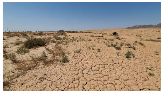
شکل ۷- رسوب‌گذاری زیاد در نهر آبرسان سامانه پخش سیلاب بر آبخوان جاجرم Figure 7- High Sedimentation in the main floodwater transfer channel of the FWSS on the Jajarm aquifer