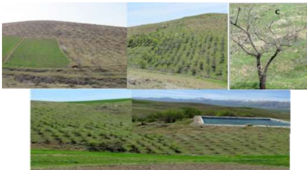
شکل (۲): نمونه بادام کاری‌های و شاهد دیمزار مربوطه (بالا) همراه با استخر جمع‌آوری آب زیرقشری (پایین)

احداث باغ در اراضی شیب‌دار به صورت سنتی و مدرن و با استفاده تکنیک استحصال آب‌های سطحی و زیرقشری در منطقه در منطقه به صورت نسبتاً گسترده و با سابقه استقرار متنوع وجود دارد. از باغ‌های ۲ تا ۳ ساله بادام که به شکل گسترده و نوینی توسط اداره کل منابع طبیعی کشت شده تا باغ‌های با سابقه طولانی چند دهه استقرار و بهره‌برداری سناریوهای متعددی را جهت ارزیابی در اختیار ما قرار داده است. محصولات عمده بادام در درجه اول و انگور به عنوان محصول دوم دو گونه غالب در این منطقه هستند. برای این مطالعه سه سناریوی مشخص از این باغ‌ها انتخاب و مورد ارزیابی قرار گرفت که عبارت بودند از: بادام کاری با سابقه طولانی بیش از ۲۰ سال (دو نقطه)، بادام کاری با سابقه کشت کمتر از ۱۰ سال و بادام کاری‌های جدید (۲ سال). گستره مورد انتخاب جهت ارزیابی در سناریوهای مذکور جمعاً ۳۲/۴۲ هکتار را پوشش می‌داد. در شکل (۲) تصاویری از آن‌ها نشان داده شده است.