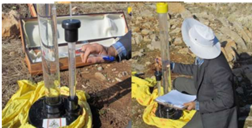
شکل (۳): اندازه‌گیری نفوذپذیری خاک به کمک دستگاه نفوذسنج صفحه‌ای

برای انجام این تحقیق یعنی بررسی تاثیر عملیات یاد شده در سناریوهای مذکور، در شاخص‌های کیفیت خاک و کنترل فرسایش و تخریب خاک به شرح زیر عمل شد. در محدوده باغ‌ها و شاهد مربوطه یعنی دیمزارهای شیب‌دار مجاور، شاخص‌های تخریب و فرسایش خاک به صورت میدانی اندازه‌گیری شد. همچنین، در مرحله مطالعه میدانی نمونه‌برداری خاک با حفر پروفیل خاک در عرصه هر عملیات و عرصه شاهد و نمونه‌برداری از لایه‌های مختلف تا عمق توسعه ریشه انجام شد. تعداد پروفیل و نمونه بسته به تنوع توپوگرافی عرصه هر عملیات حداکثر سه پروفیل در نظر گرفته شد. نمونه‌های خاک به آزمایشگاه منتقل و آزمایشات تعیین شاخص‌های کیفیت فیزیکوشیمیایی خاک بر روی آنها انجام شد. برای این منظور آزمایشات تعیین بافت به روش هیدرومتر، اسیدیته و هدایت الکتریکی (EC)، درصد کربن آلی خاک به روش والکی بلاک، درصد آهک یا مواد خنثی شونده، عناصر غذایی ماکرو (NPK) و میکرو (Mn, Fe, Cu و Zn) به کمک روش‌های آزمایشگاهی استاندارد بر روی نمونه‌های جمع‌آوری شده انجام شد. همچنین برای تعیین شاخص نفوذپذیری آب در خاک از دستگاه نفوذسنج صفحه‌ای یا دیسک پرماتر در تیمارها و نقاط مطالعاتی و به روش اندازه‌گیری مزرعه‌ای استفاده شد (شکل ۳).