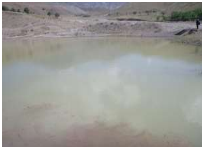
شکل (۷): تصویر آبخیزی سال ۱۳۸۸ تورکینست شماره ۱ در کنار رودخانه، بالادست مادر چاه قنات