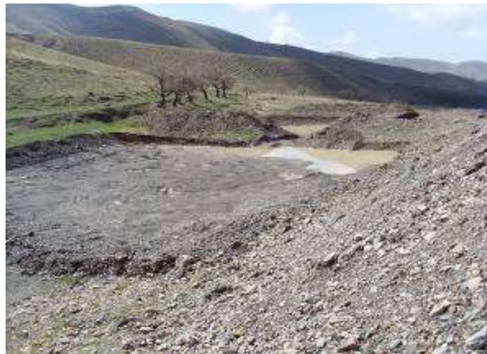
شکل (۶): عملیات اجرایی تورکینست شماره ۲ در کنار رودخانه مشنق