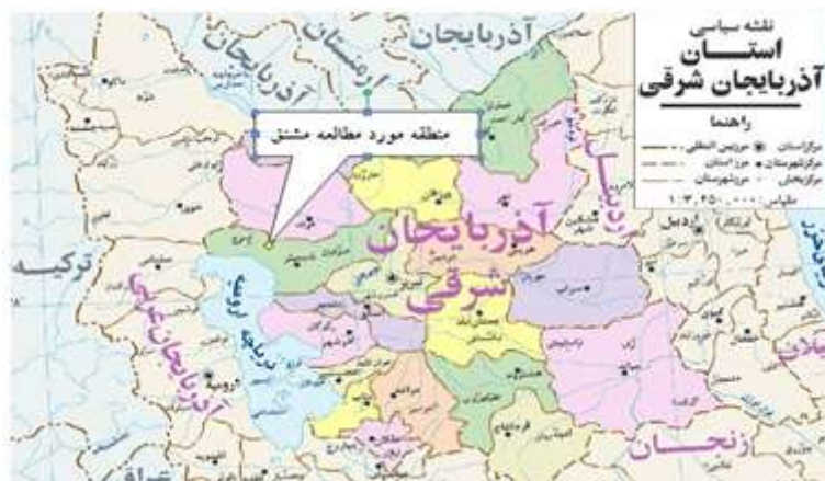
شکل (۱): موقعیت منطقه در حوضه آبخیز استان

منطقه مطالعاتی در استان آذربایجان شرقی، شهرستان شبستر در شمال شرق دریاچه ارومیه در مختصات جغرافیایی عرض شمالی 38^{\circ}13' تا 38^{\circ}17' و طول شرقی 45^{\circ}33' تا 45^{\circ}36' واقع شده است. این منطقه به نام حوضه آبخیز مشنق، کنار روستای مشنق، در زیر حوضه دریاچه‌ای قرار دارد (شکل ۱). بارش متوسط منطقه ۲۸۸ میلی‌متر و متوسط دمای کل حوضه 4/62 درجه سانتی‌گراد است. مجموع سالانه تبخیر و تعرق به روش تورنت وایت که با استفاده از میانگین ماهانه دمای منطقه محاسبه شده، تقریباً ۸۰۰ میلی‌متر در سال برآورد شده است. بر اساس طبقه بندی اقلیمی روش آمبرژه اقلیم حوضه نیمه خشک سرد تا خشک سرد تعیین شده است. حداکثر ارتفاع حوضه ۲۷۵۰ متر و حداقل آن ۱۷۶۰ متر است. طول آبراهه اصلی در موقعیت مادر چاه قنات اصلی مشنق 5/88 کیلومتر و شیب آن ۵ درصد است.