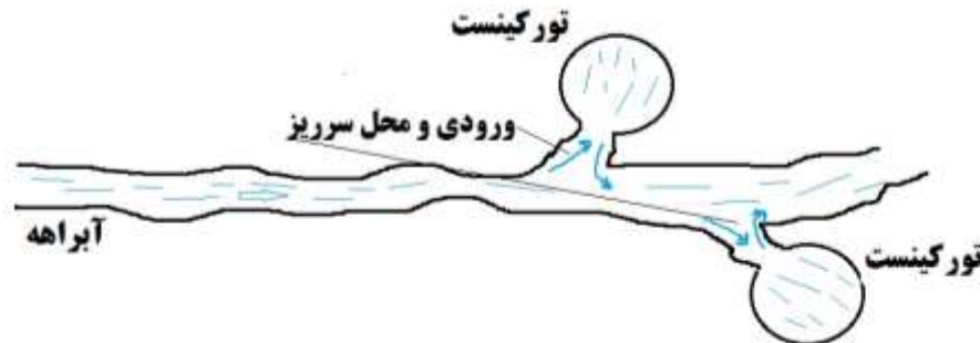
شکل (۴): موقعیت احداث تورکینست در کنار بستر رودخانه

تورکینست دارای کاربری‌های متعدد بوده که می‌توان با رعایت اصول طراحی، اجرا و بهره برداری در راستای مدیریت مؤثر منابع آبی از دیدگاه کمی و کیفی به منظور مقابله با اثرات خشکسالی در احیاء چشمه‌ها و قنات‌ها از آن استفاده نمود.