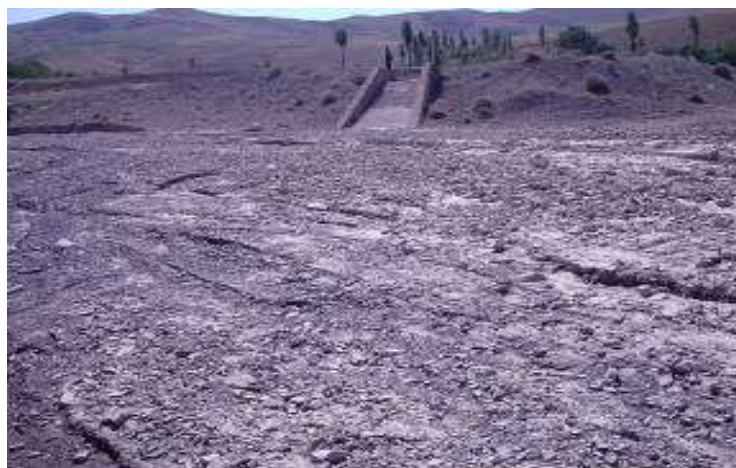
شکل (۵): احداث سرریز در پایاب تورکینست

در حوضه آبخیز مشنق ۲ مورد سامانه تورکینست با مشخصات درج شده در جدول (۵) در کنار بستر رودخانه با مشارکت روستائیان احداث شده است. این دو سازه با اقتباس از روش شکل (۴) کنار رودخانه‌ای بوده در هر دوره بارش و ایجاد سیلاب در حدود ۳۰ هزار متر مکعب آبیگیری خواهند داشت. شکل (۶) تورکینست شماره ۲ در مرحله عملیات اجرایی و شکل (۷) تورکینست شماره ۱ حوضه را پس از آبیگیری از سیلاب با دبی ۱۶ متر مکعب بر ثانیه (این سیلاب در تیرماه ۱۳۸۸ حادث شده و دوره بازگشت ۲۰ ساله بوده است) نشان می‌دهد.