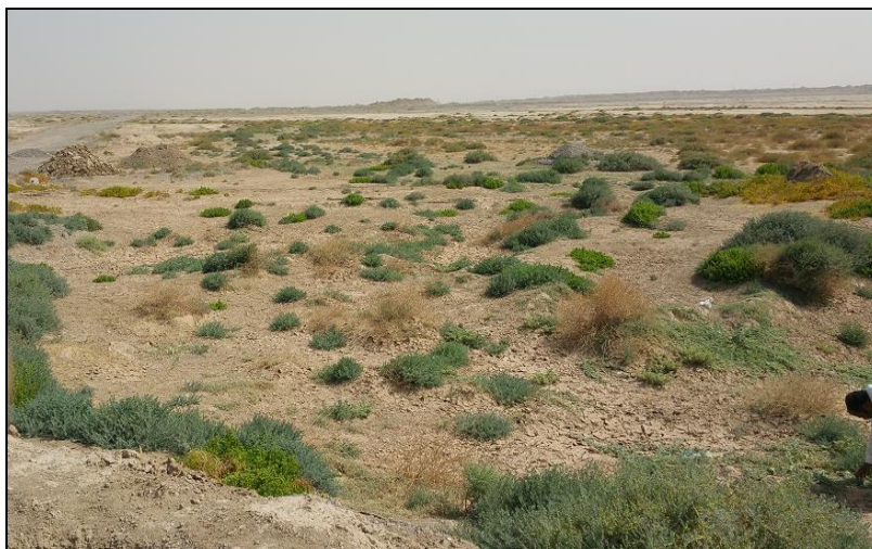
شکل ۴- نمایی از محدوده سطوح آبگیر باران مورد مطالعه