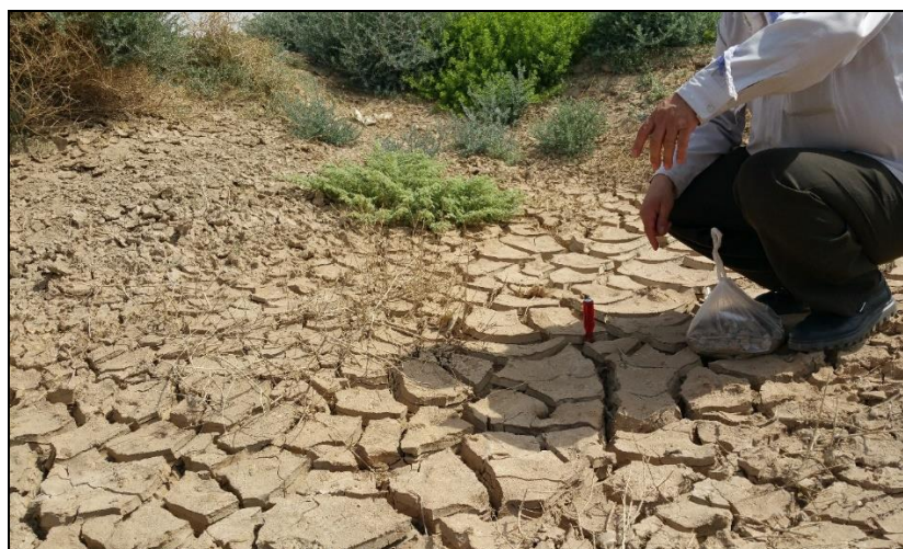
شکل ۳- نمایی از میزان ترسیب رسوبات در سطوح آبیگر باران

** : Significant difference in the level of 1%