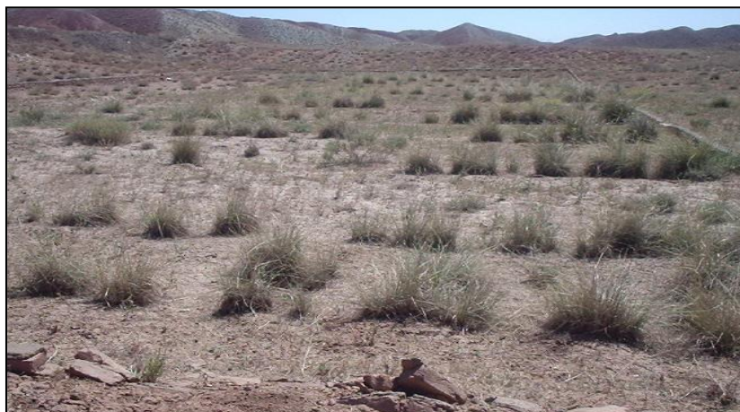
شکل ۵- تیمار کنتورفارو بعد از کاشت گیاه آگروپیرون النگاتوم