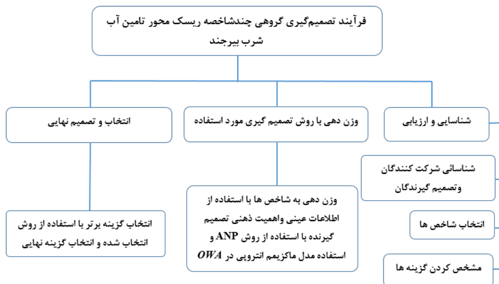
شکل ۲- فرآیند تصمیم‌گیری گروهی چند شاخصه ریسک محور تامین آب شرب بیرجند

انتقال آب از دریای عمان، انتقال آب از غرب کشور (زاینده‌رود)، انتقال آب از سد دوستی و استفاده از آب‌های متعارف منطقه (جداسازی شبکه توزیع آب بهداشتی و آب شرب) انتخاب شد.