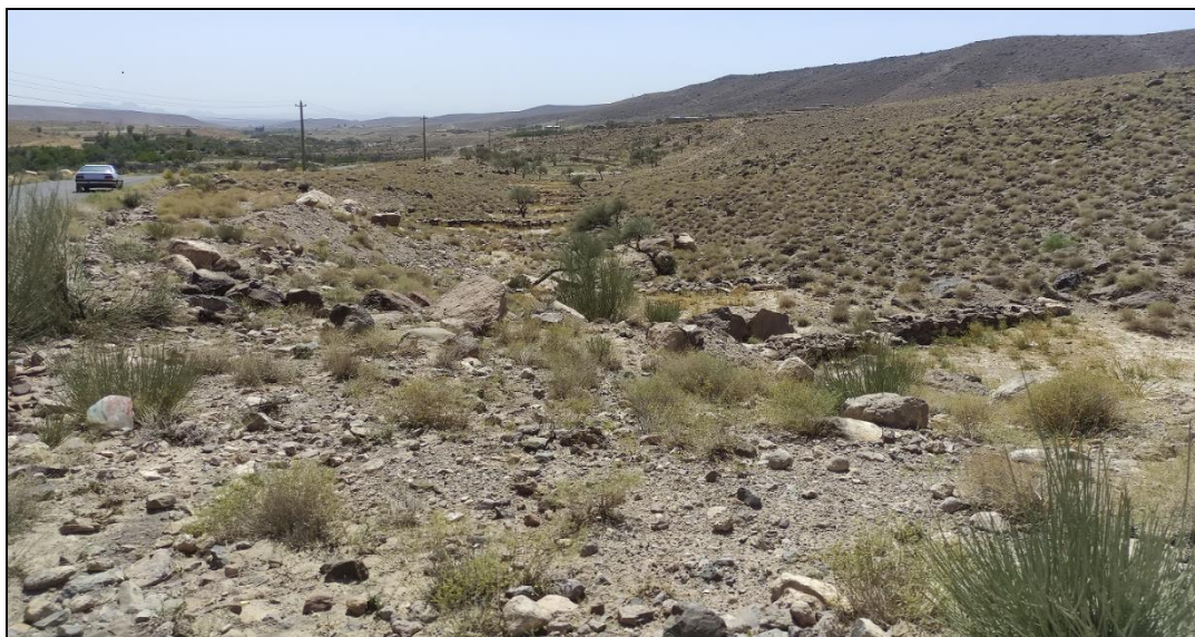
شکل ۲- نمایی از محدوده سطوح آنگیر باران مورد مطالعه Figure 2- A view of the range of studied rainwater catchment systems