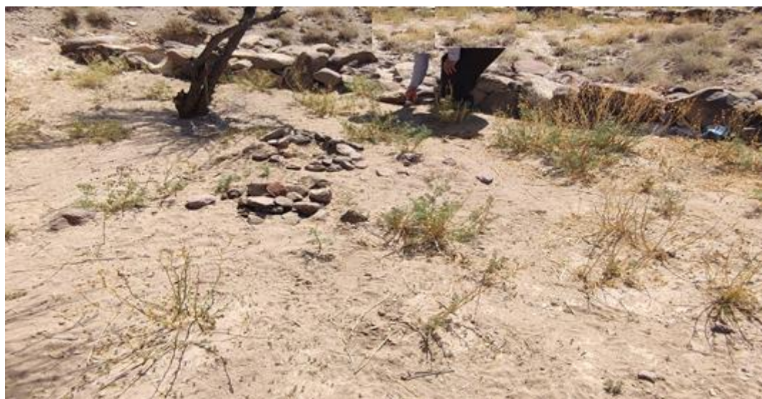
شکل ۳- نمایی از میزان ترسیب رسوبات در مخزن بند Figure 3- A view of the amount of sediment in reservoir of the check dam