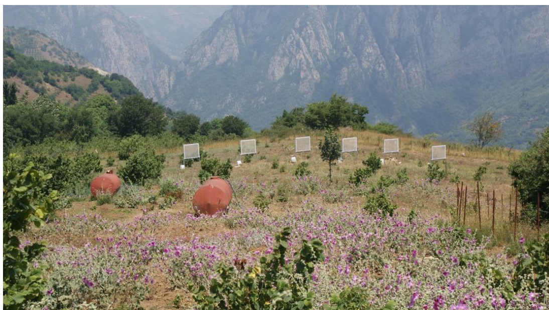
شکل ۴- نمایی از استقرار سامانه‌های جمع‌کننده پرده‌ای آب از مه در روستای سراورسو- اشکورات

با تعبیه مخازن جمع‌آوری آب، حجم آب ذخیره شده در هر یک از جمع‌کننده‌ها با بشر مدرج اندازه‌گیری شدند (شکل ۵). دیده‌بانی در ساعت ۱۳ هر روز انجام و در صورت رخداد مه، میزان آب جمع‌آوری شده در مخزن اندازه‌گیری شد.