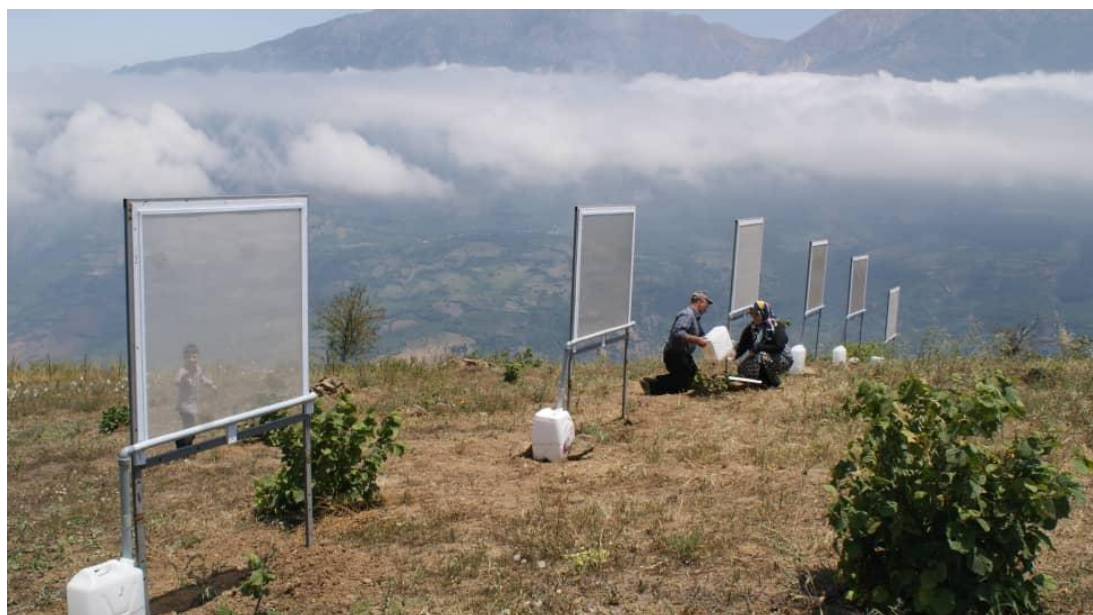
شکل ۵- نمایی از اندازه‌گیری آب جمع‌آوری شده در مخازن Figure 5- A view of measuring water collected in tanks