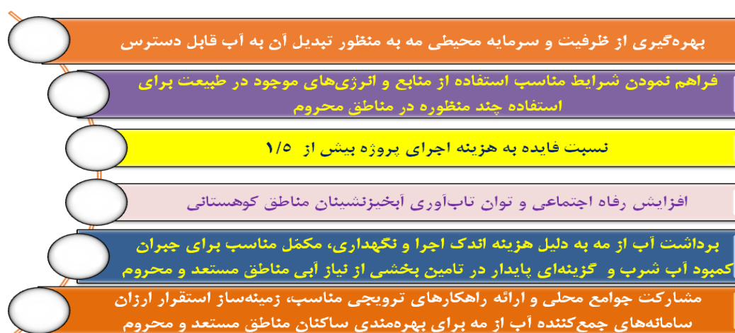
شکل ۸- پتانسیل اقتصادی و اثربخشی جمع‌آوری آب از مه در مناطق کوهستانی مستعد