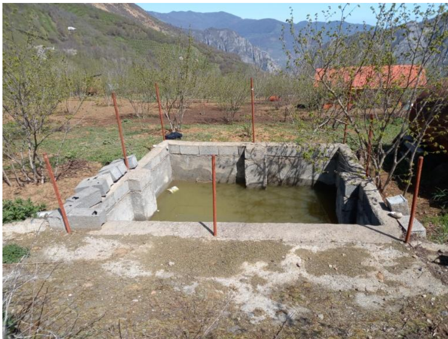
شکل ۲- جمع‌آوری آب باران از سطح کوچک آبگیر و ذخیره آن در مخزن در روستای سراورسو Figure 2- Collecting rainwater from a small catchment area and storing it in a reservoir in the village of Saraversoo

با توجه به وجود مه در مناطق کوهستانی اشکور شهرستان رودسر و در روستای سراورسو، در این مقاله جمع‌آوری آب از مه کوهستانی با هدف بررسی امکان استحصال آب از مه به‌منظور افزایش توان تاب‌آوری ساکنین این مناطق در مواجهه با بحران کم‌آبی بررسی شده است.