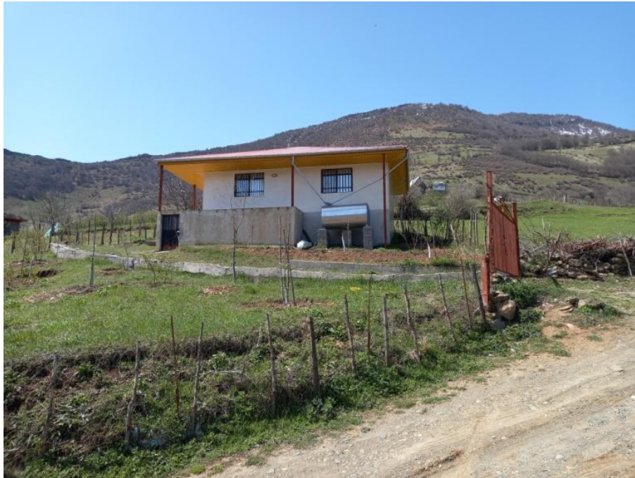
شکل ۱- نمایی از استحصال آب باران از سقف شیروانی در روستای سراورسو Figure 1- A view of rainwater harvesting from a gable roof in the village of Saraversoo

مناطق با ایجاد سامانه‌های نعل‌اسبی جمع‌آوری رواناب در شیب بالایی درختان فندق، رطوبت خاک را در محدوده توسعه ریشه این درختان ذخیره می‌کنند (کمالی، ۱۴۰۱).